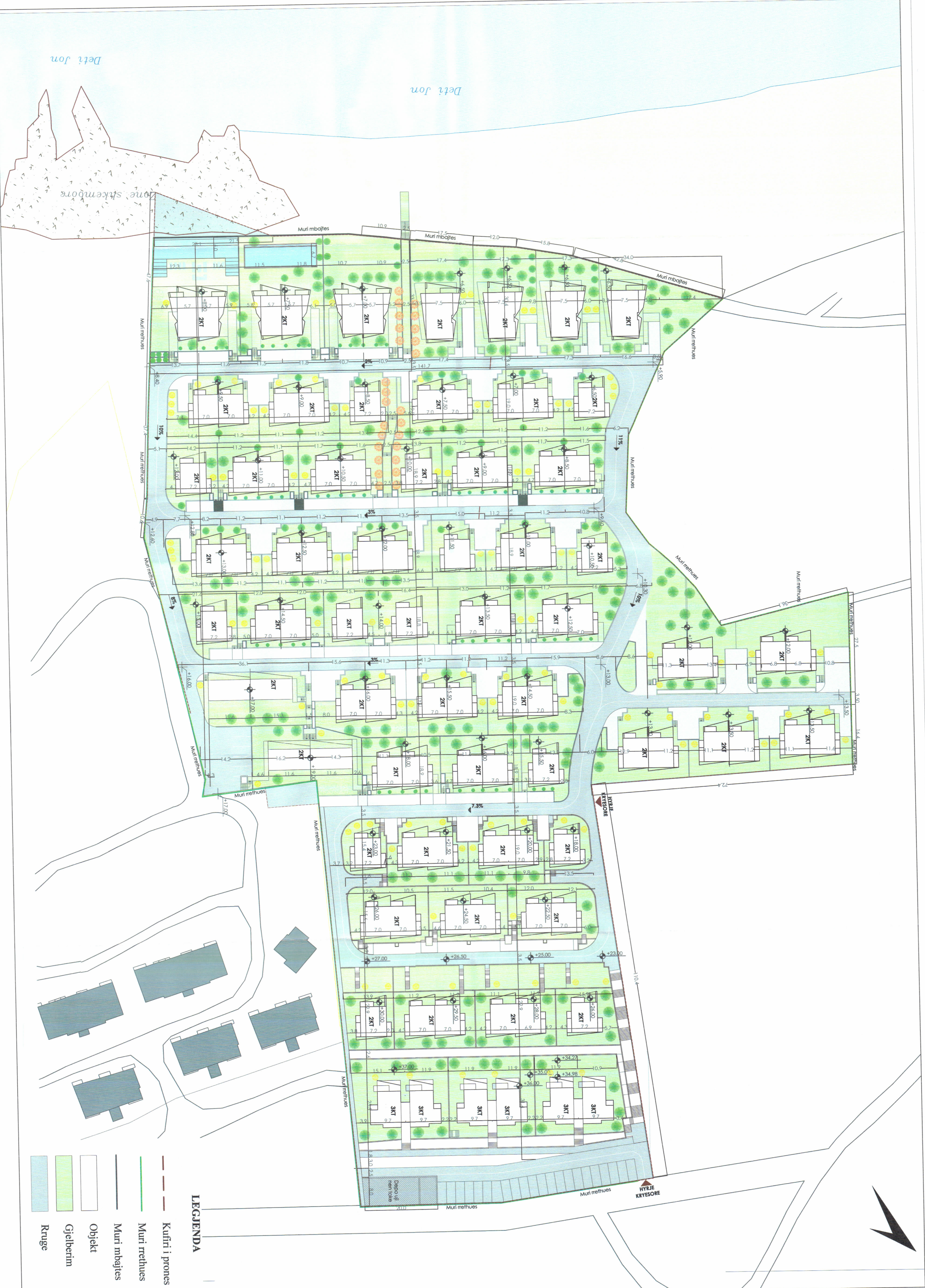
PLANI I VENDOSJES SË STRUKTURËS SHK. 1: 500