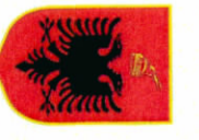
BASHKIA VLORE HARTA E VENDODHJEVE TE STRUKTURAVE TE PLAZHIT

REPUBLIKA E SHQIPËRISË KESHILLI KOMBETAR I TERRITORIT