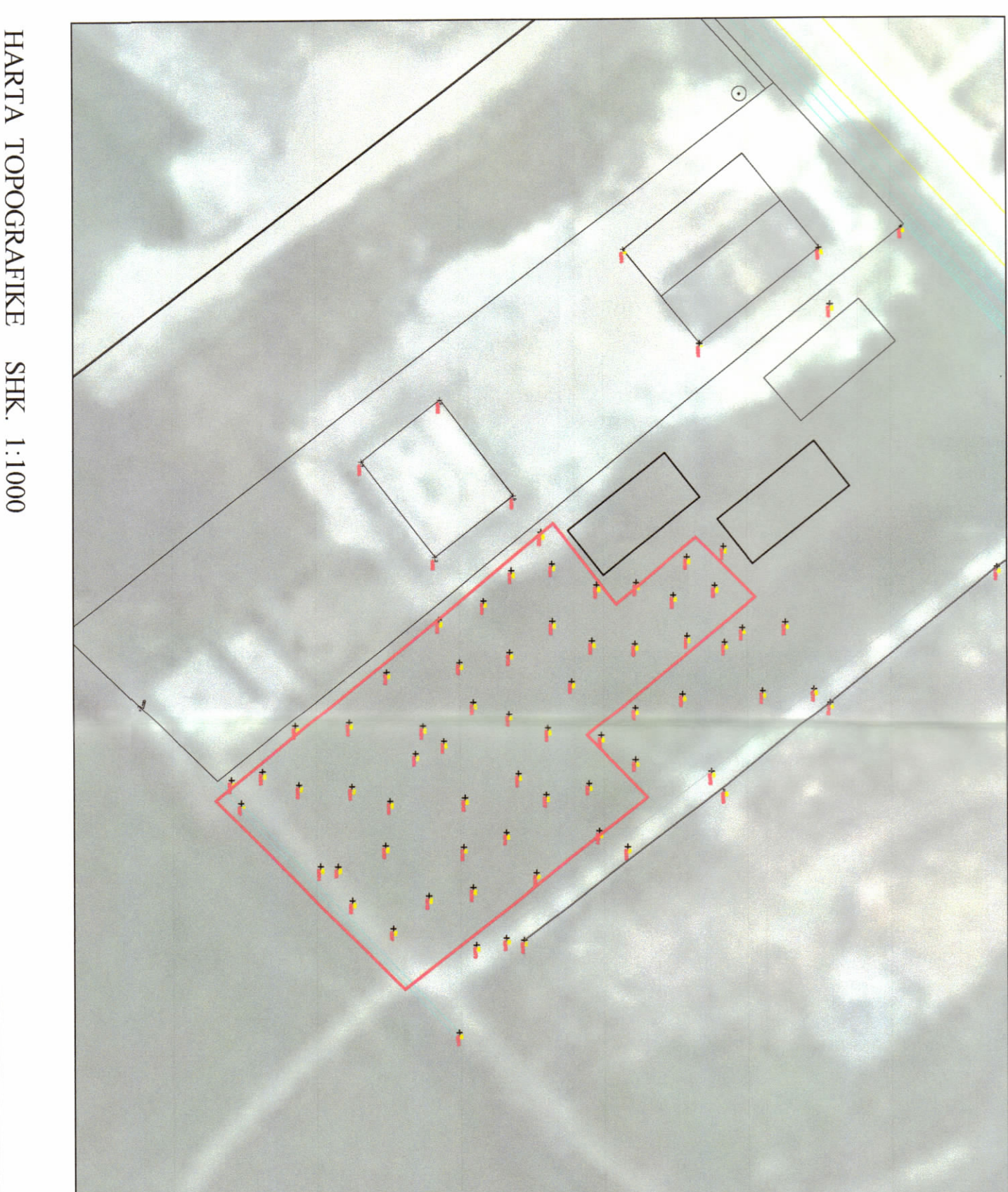
POZICIONI KADASTRAL SHK. 1:1000