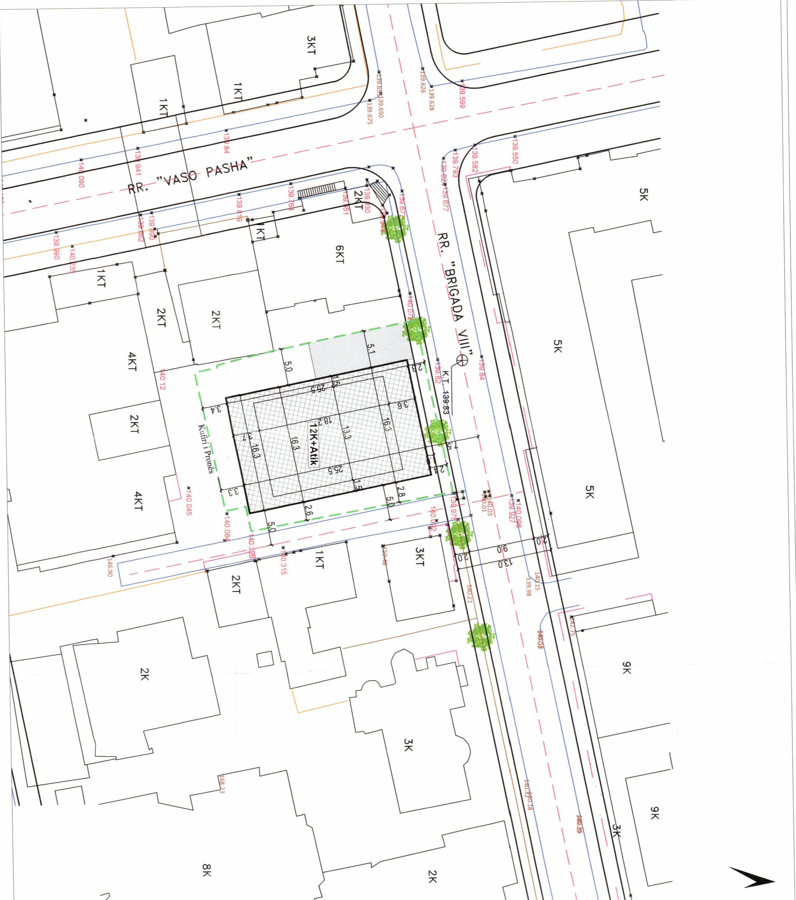
PLANI I VENDOSJES SË STRUKTURËS SHK. 1:200