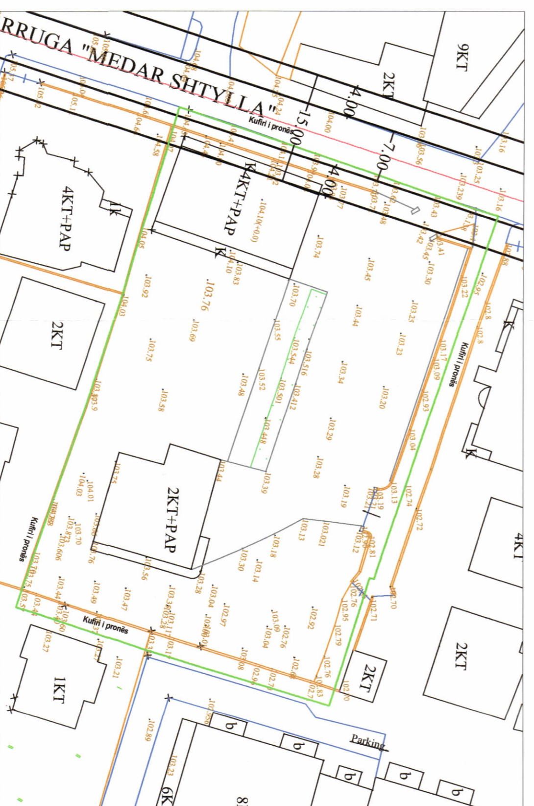
HARTA TOPOGRAFIKE SHK. 1:2000