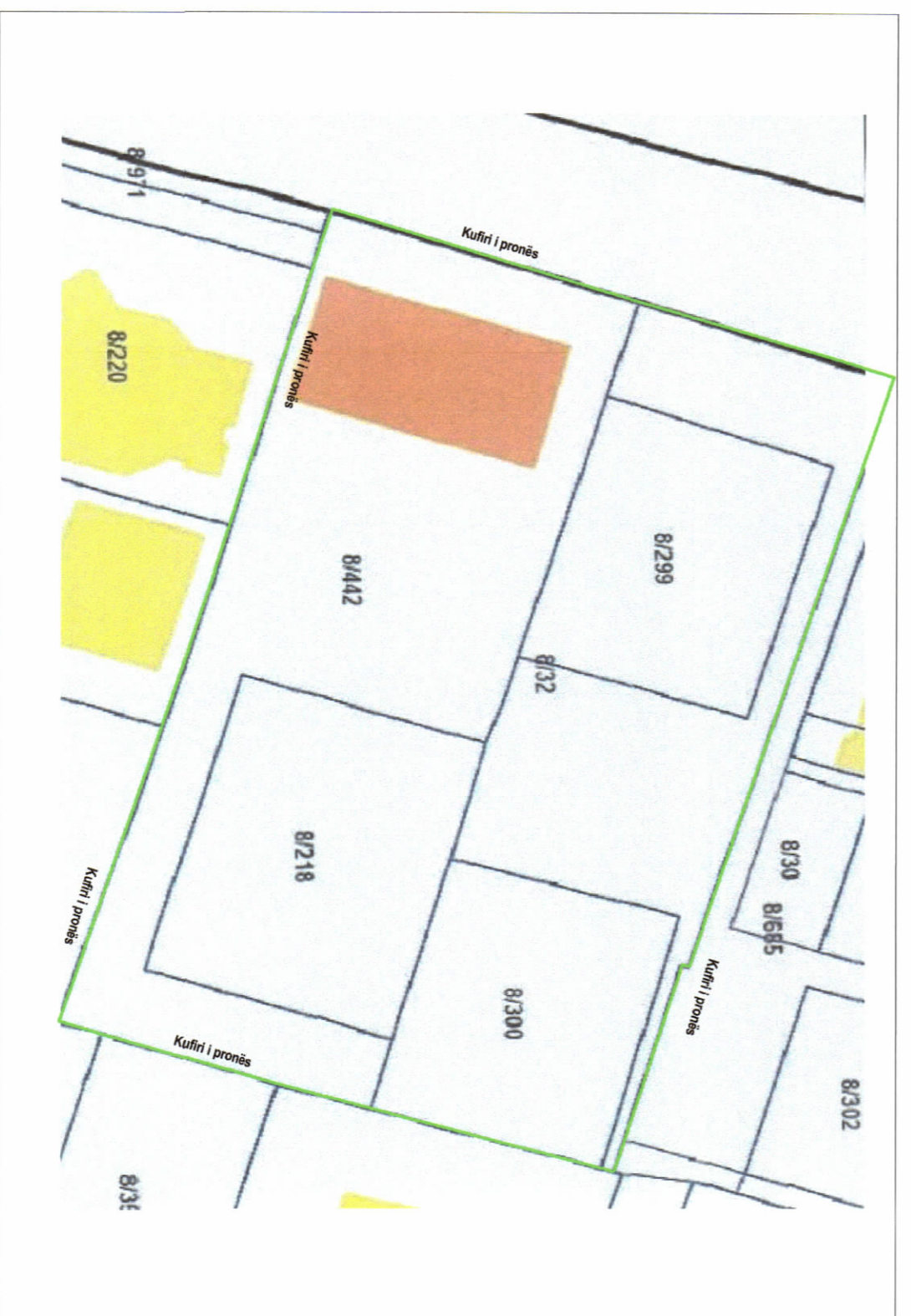
POZICIONI KADASTRAL SHK. 1:2000