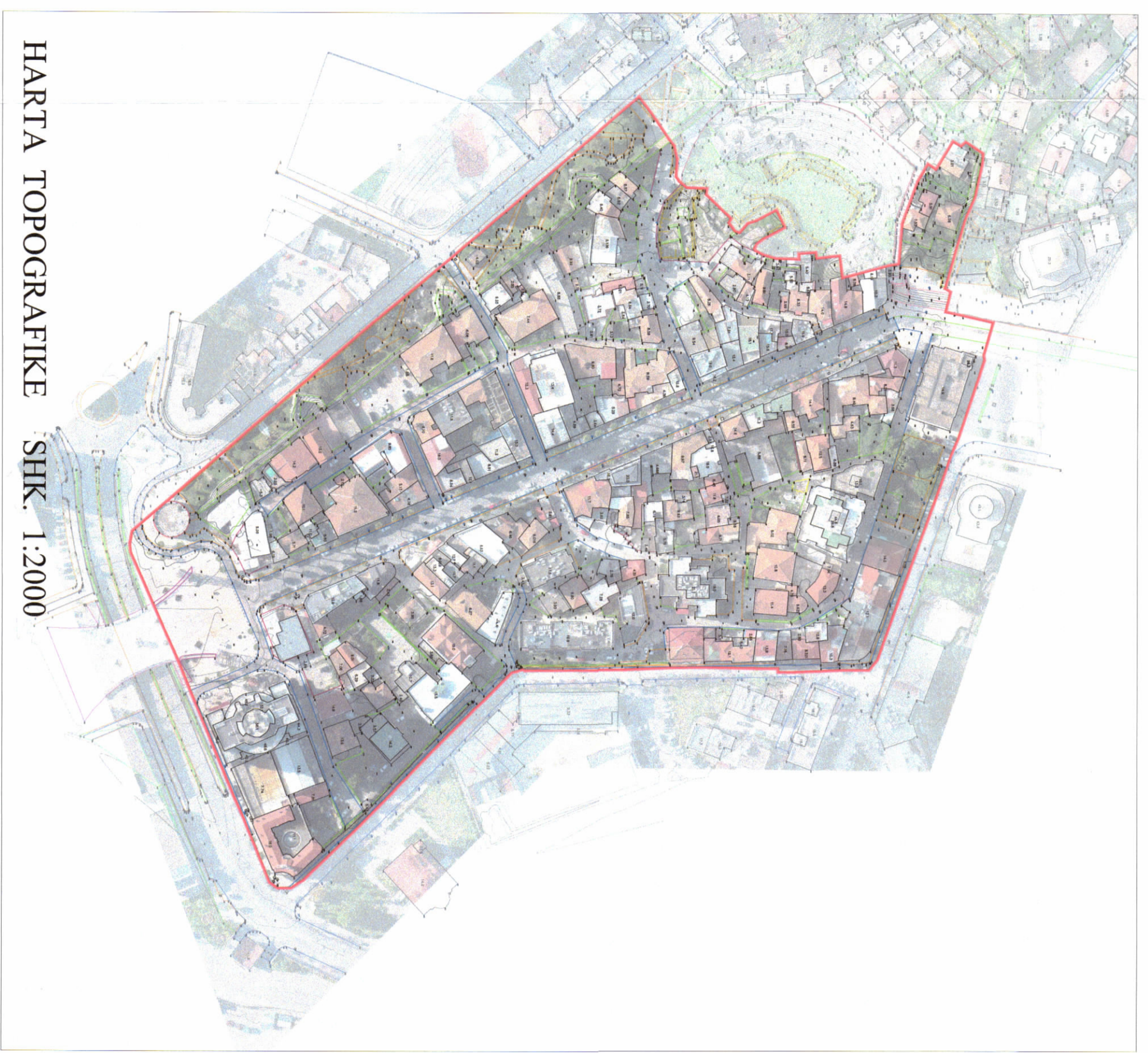
HARTA TOPOGRAFIKE SHK. 1:2000