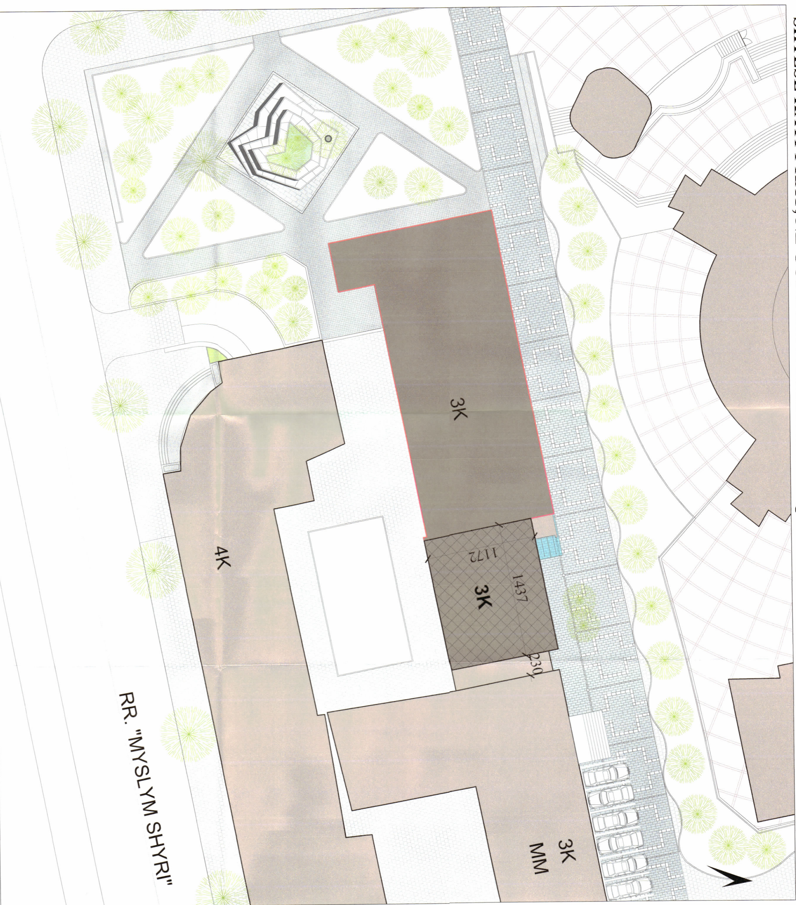
PLANI I VENDOSIES SË STRUKTURËS SHK. 1:250