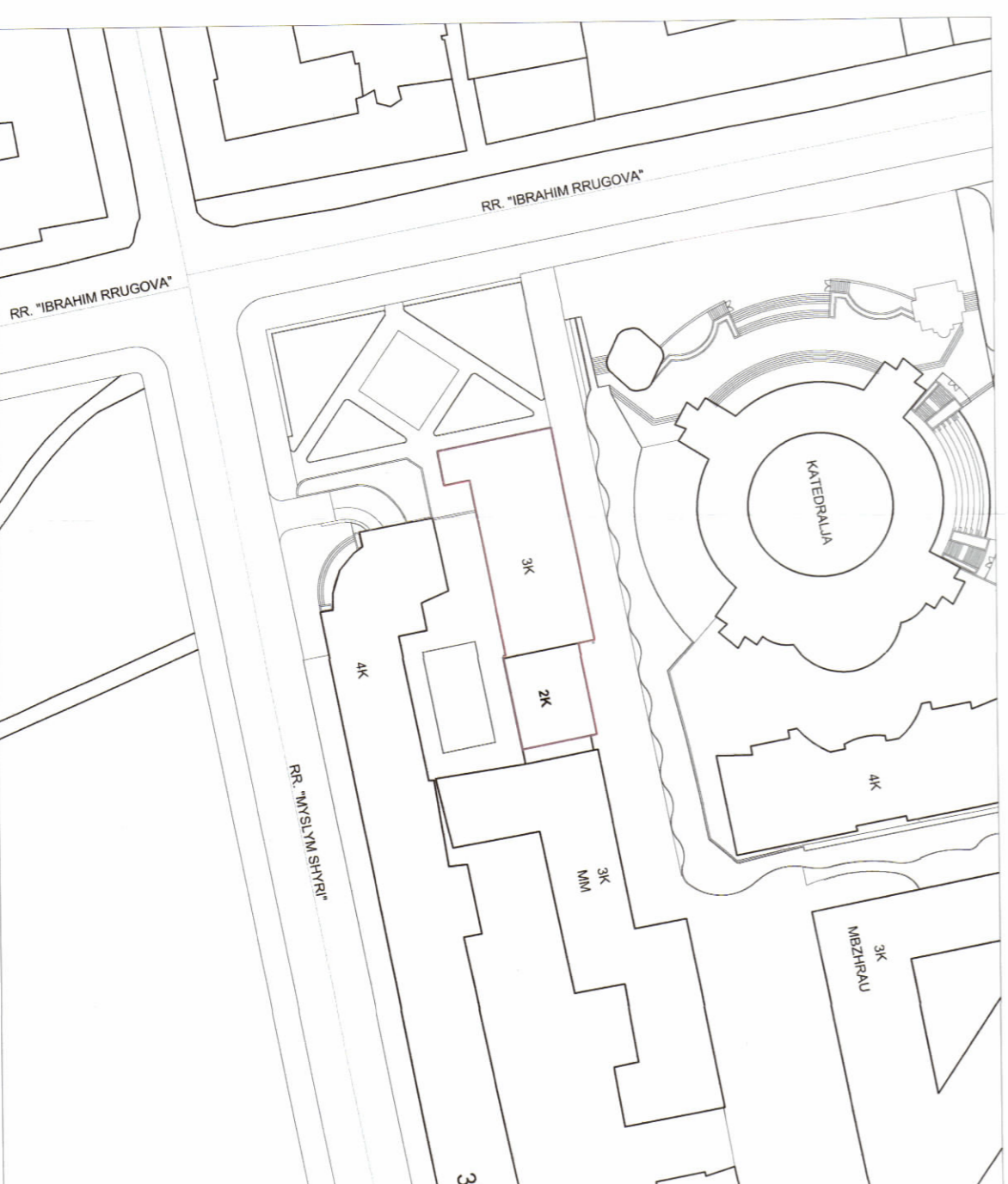
HARTA TOPOGRAFIKE SHK. 1:1000