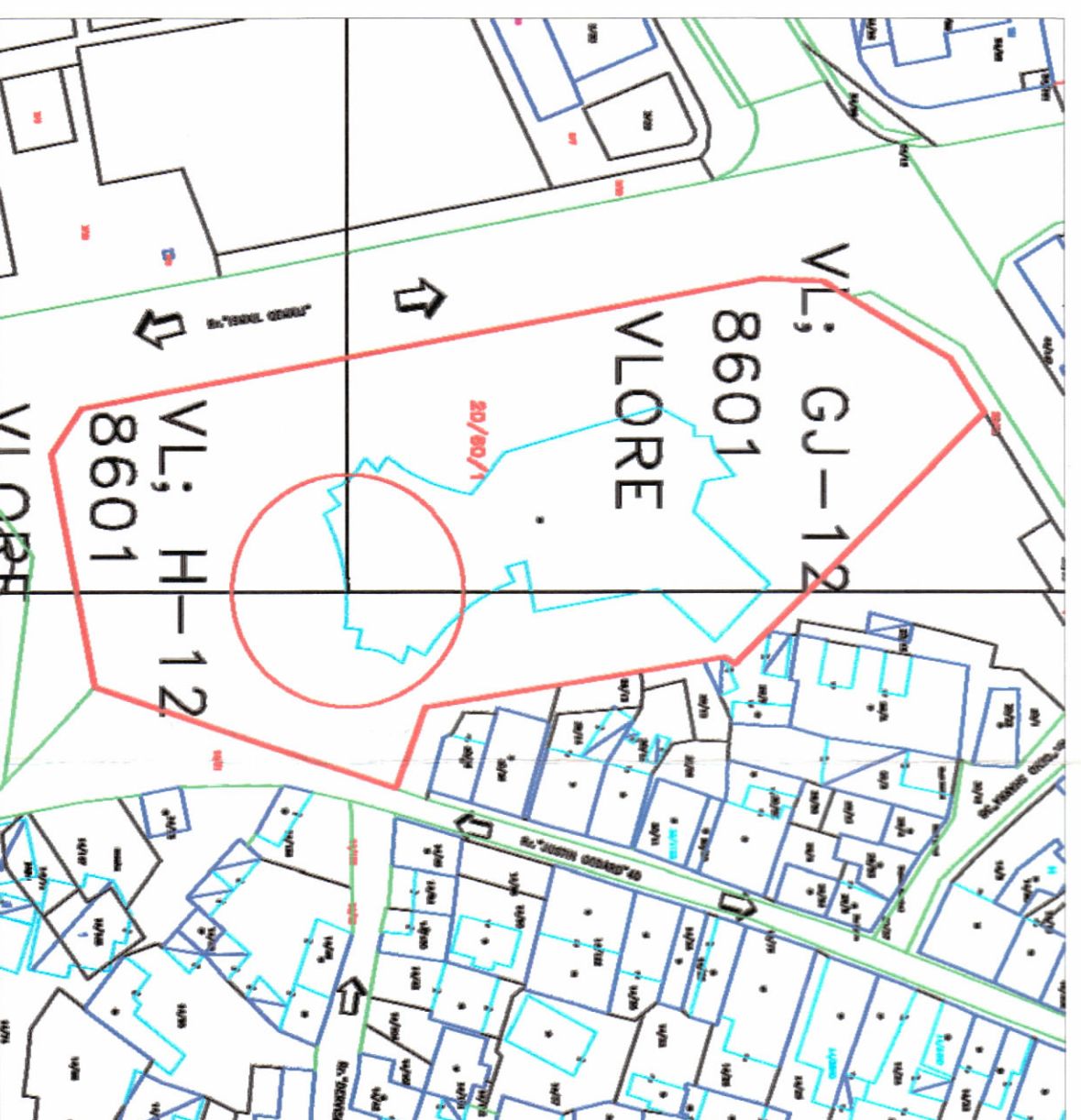
POZICIONI KADASTRAL SHK. 1:1200