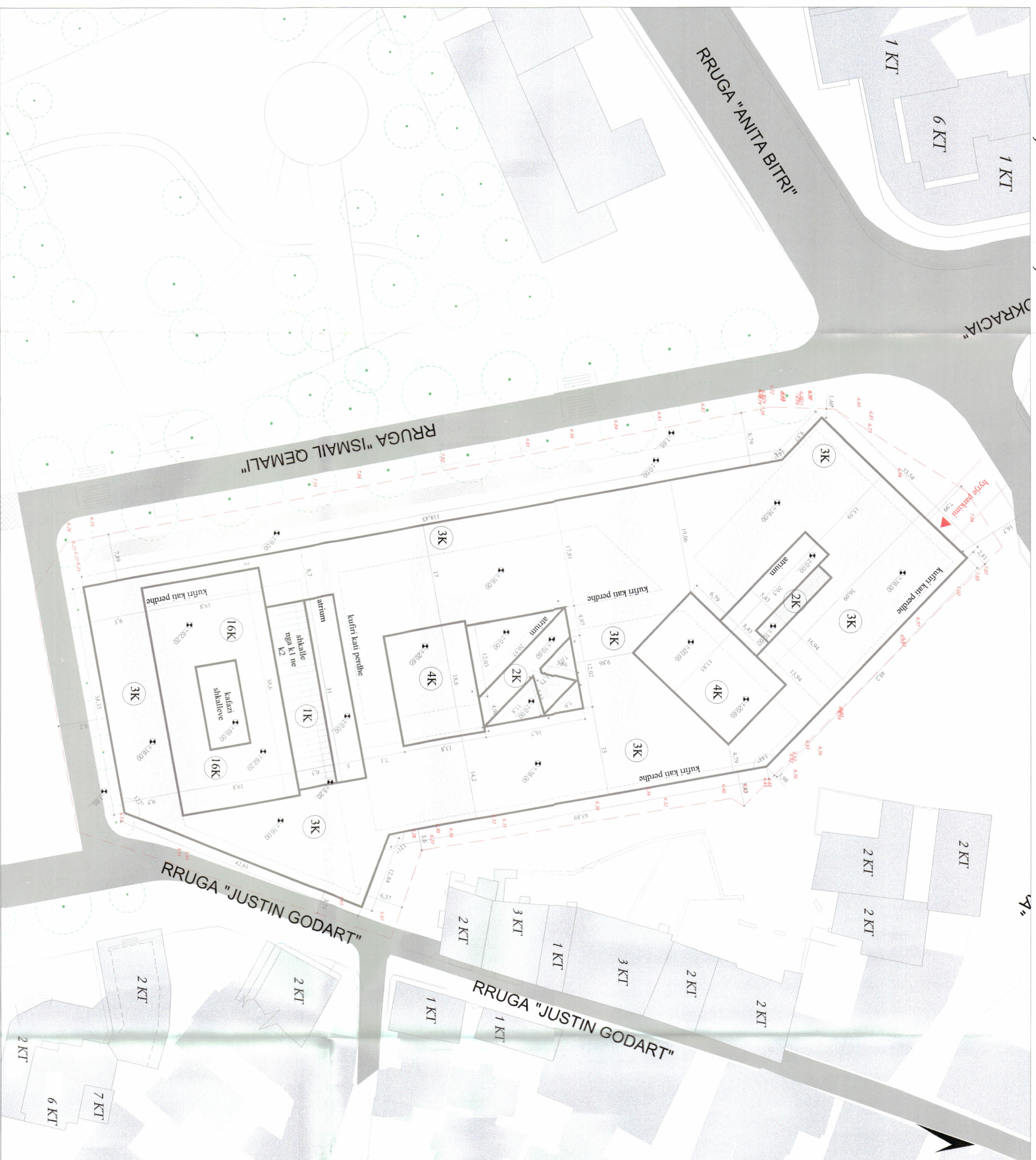
PLANI I VENDOSJES SË STRUKTURËS SHK. 1:500