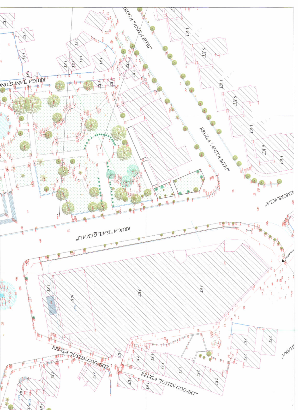
HARTA TOPOGRAFIKE SHK. 1:1200