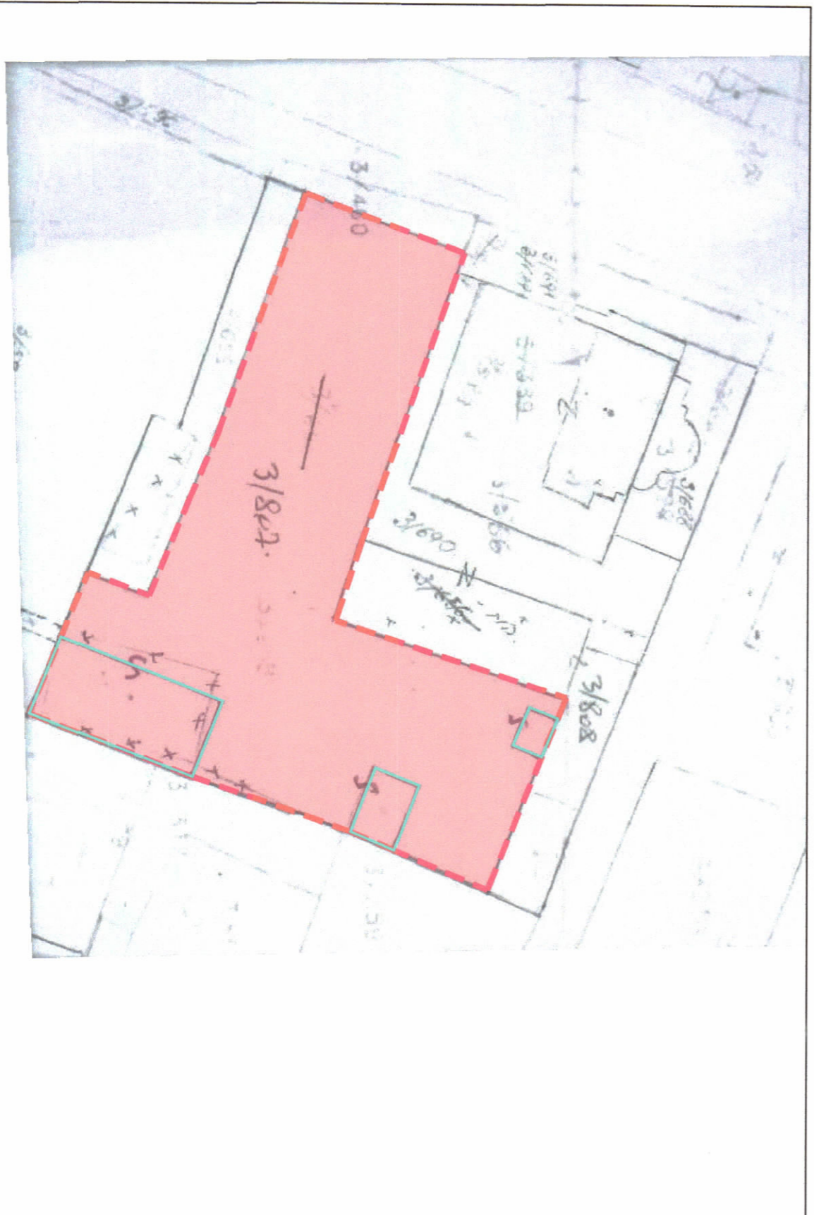
POZICIONI KADASTRAL SHK.1:500