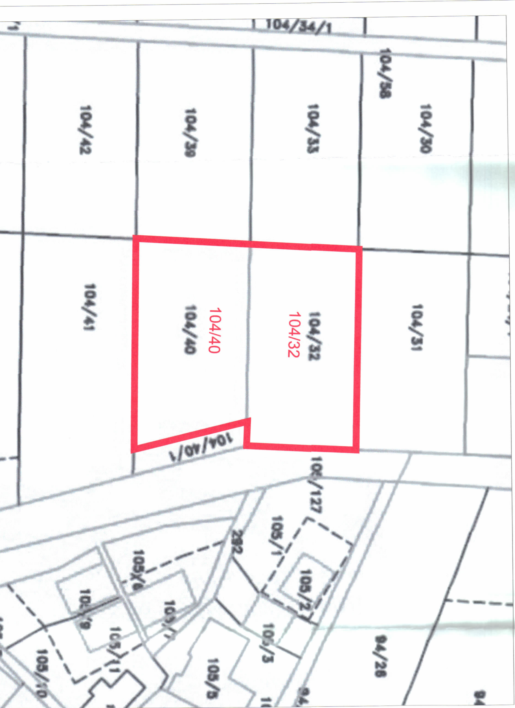
POZICIONI KADASTRAL SHK. 1:500