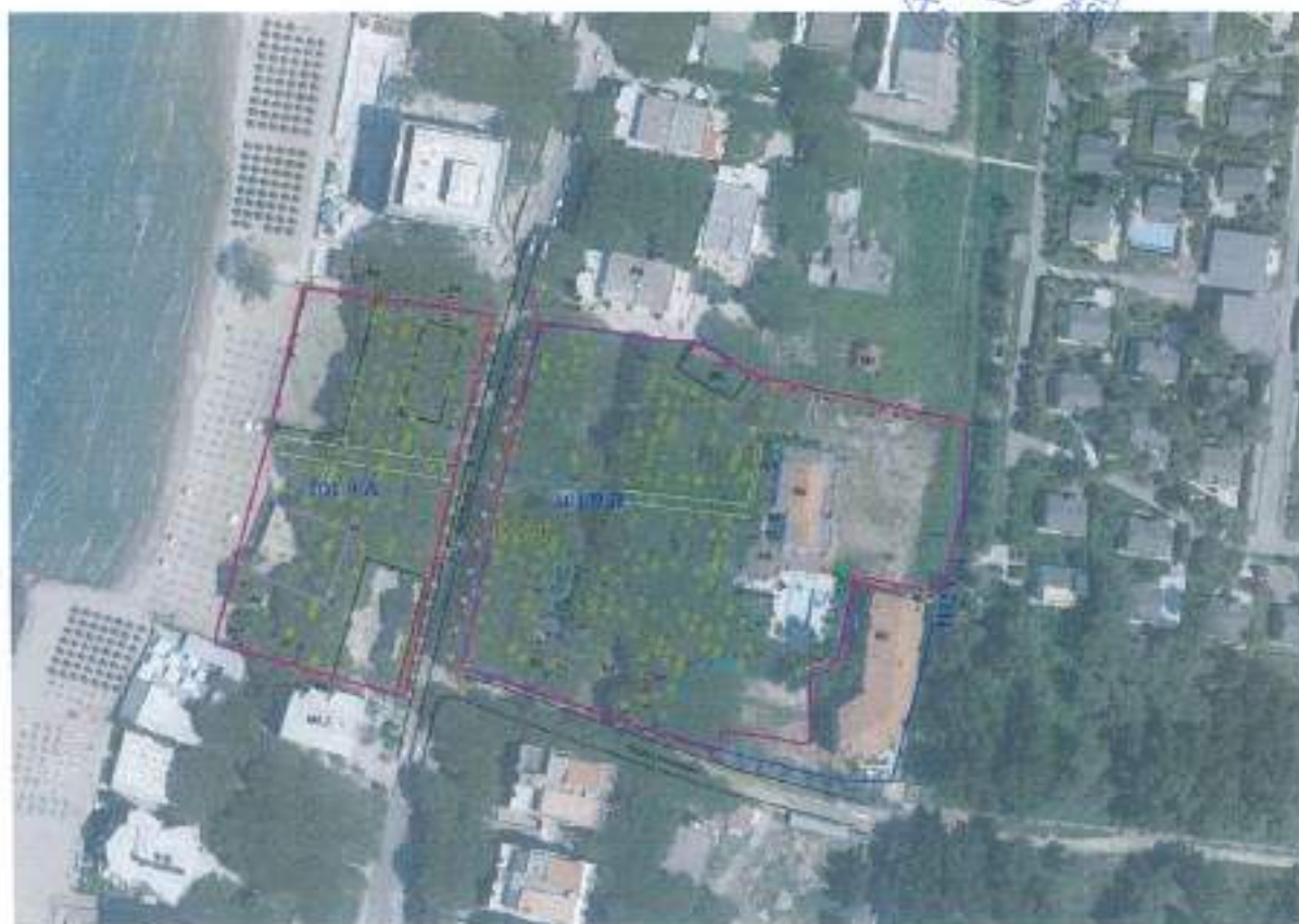
Figura 6. Gjendja ekzistuese e zonës në zhvillim