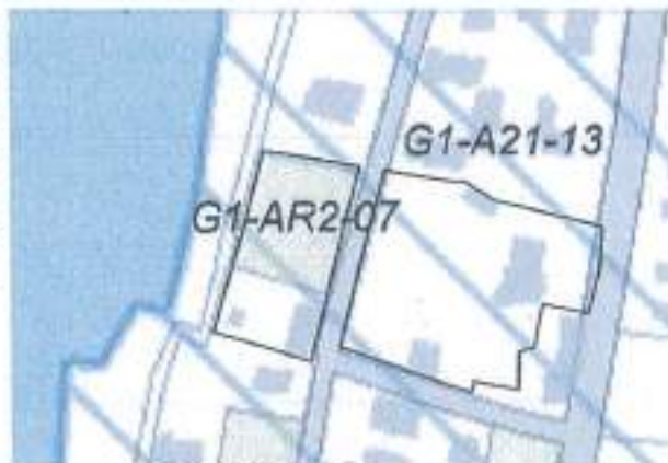
Figura 3. Harta e njësisë strukturore