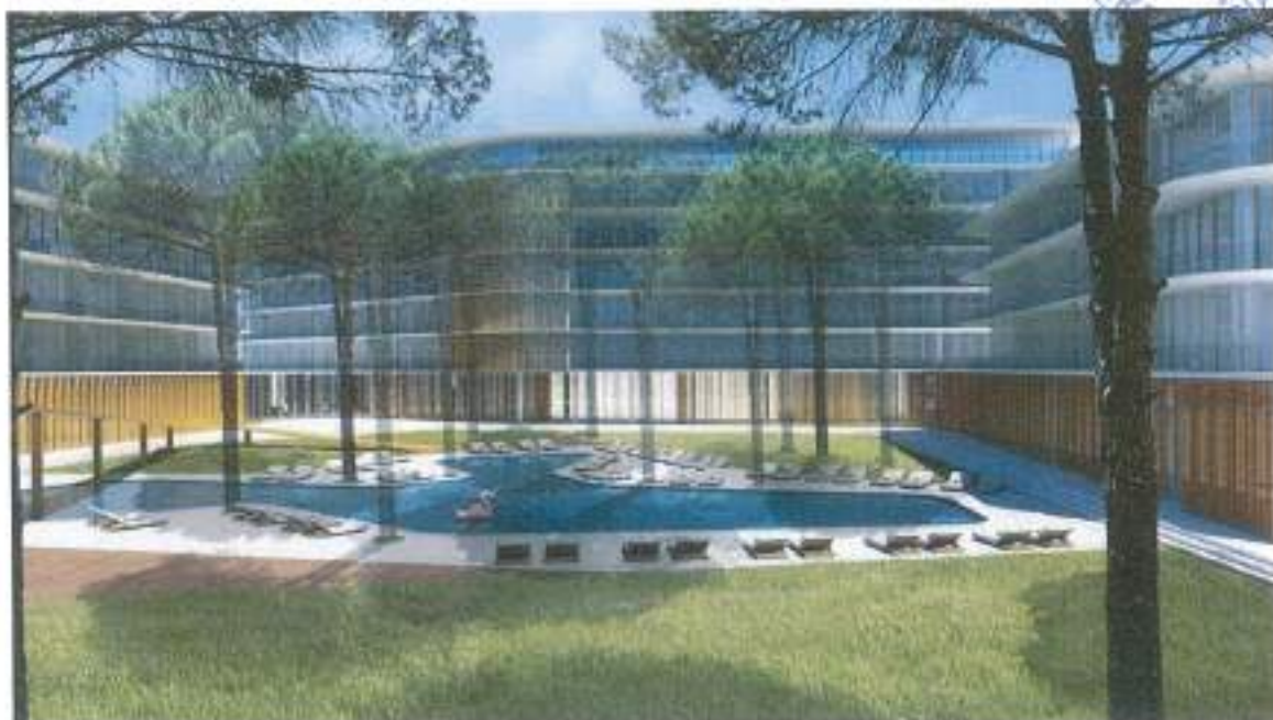
Figura 8. Imazh render_01

Ndër problemet që konstatuam gjatë vizitës në terrën, ishte çështja e aksesit në pronë. Duke parë me prespektivën e një resorti model dhe bashkëkohor, i cili do ketë fluks të lartë turistësh, propozojmë akses në të gjitha drejtimet si dhe akses të veçantë për autobusat. Siç u përmend pak më lart, në projekt përfshihet një kat nëntokë, i cili jo vetëm do të shërbejë si parkim për automjete, por edhe për shpërndarjen e funksioneve në shërbim të hotelit si ambiente magazinimi, teknike dhe lavanderi.