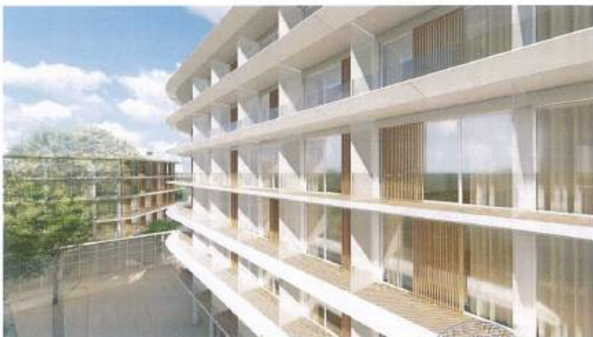
Figura 13. Imazhe render_03