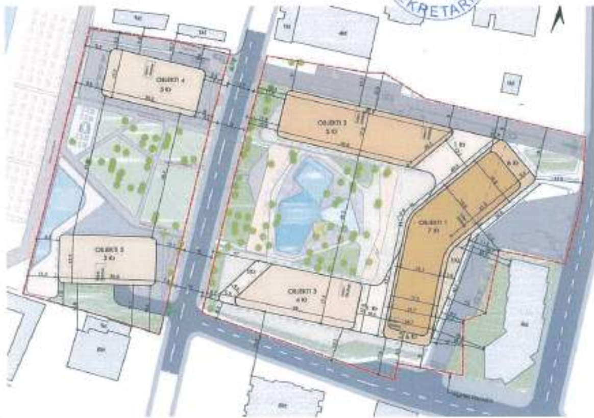
Figura 9. Planvendosja e projektit

Projekti ynë parashikon dy pishina, njëra e vendosur në zonën qendrore, në mes të pishave, ndërkohë tjetra e vendosur pranë plazhit.