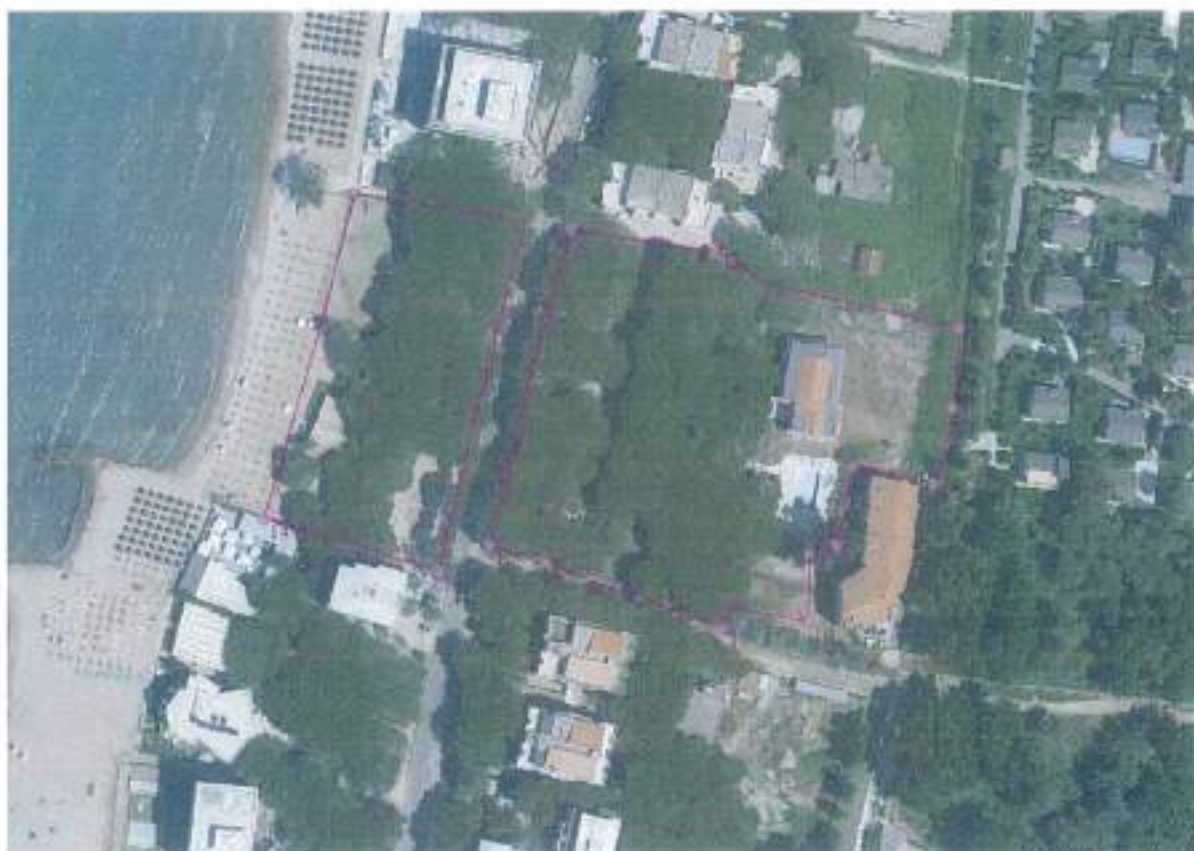
Figura I. Vendndodhje e objektit