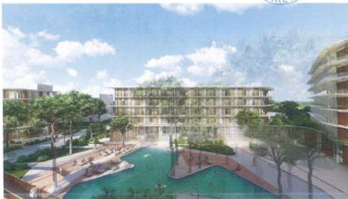
Figura 14. Imazhe render_04