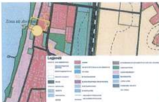
Figura 2. Harta e përdorimit të tokës

Duke u bazuar në rregulloren e Planit të Përgjithshëm Vendor të bashkisë Kavajë, të miratuar pranë Këshillit Kombëtar të Territorit, me nr. Vendimi 2, datë 27/04/2018 "Për miratimin e planit të përgjithshëm vendor bashkia Kavajë", janë vlerësuar dhe respektuar të gjitha kategoritë e përdorimit të tokës që propozon plani si dhe parametrat e zhvillimit të saj.