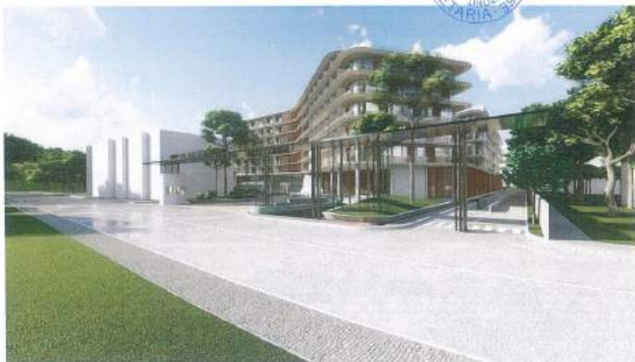
Figura 12. Imazhe render_02

Lidhur me parkimin e makinave, është propozuar 1 kat nëntokë (me një total prej 187 parkime). Janë menduar gjithashtu parkime të hapura për vizitorët.