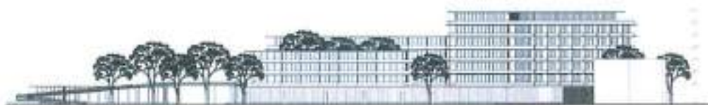
Figura 105. Fasada

Materiali kryesor që do të përdoret është xhami, i cili përbën rreth 80% të fasadave të objektit, xhami do të jetë dopio me gas argon midis dy xhamave për të rritur komfortin dhe efikasitetin e energjisë në ambientet e brendshme. Kjo zgjedhje ka si qëllim lehtësimin e fasadës së hotelit si dhe reflektimin e kontekstit përreth për të pasur një impakti sa më të vogël në zonë. Pjesët e tjera të fasadave të hoteleve janë të izoluar dhe të lyera me ngjyrë të bardhë, gjithashtu për hijezimin e fasadës, do të përdoret elementi i "brise-soleil" horizontal i cili do jetë prej materiali kompoziti të bardhë, dhe do shtrihet në gjithë perimetrin e jashtëm të objekteve në secilin kat.