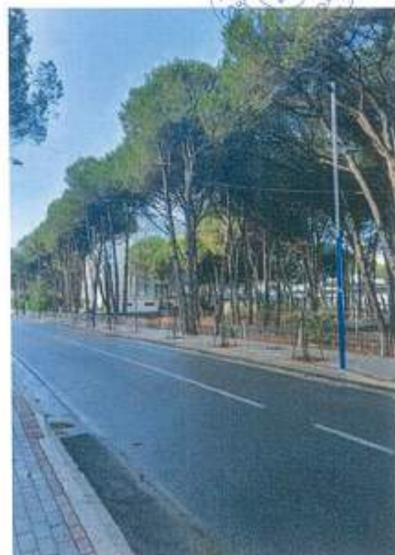
Figura 7. Foto nga zona