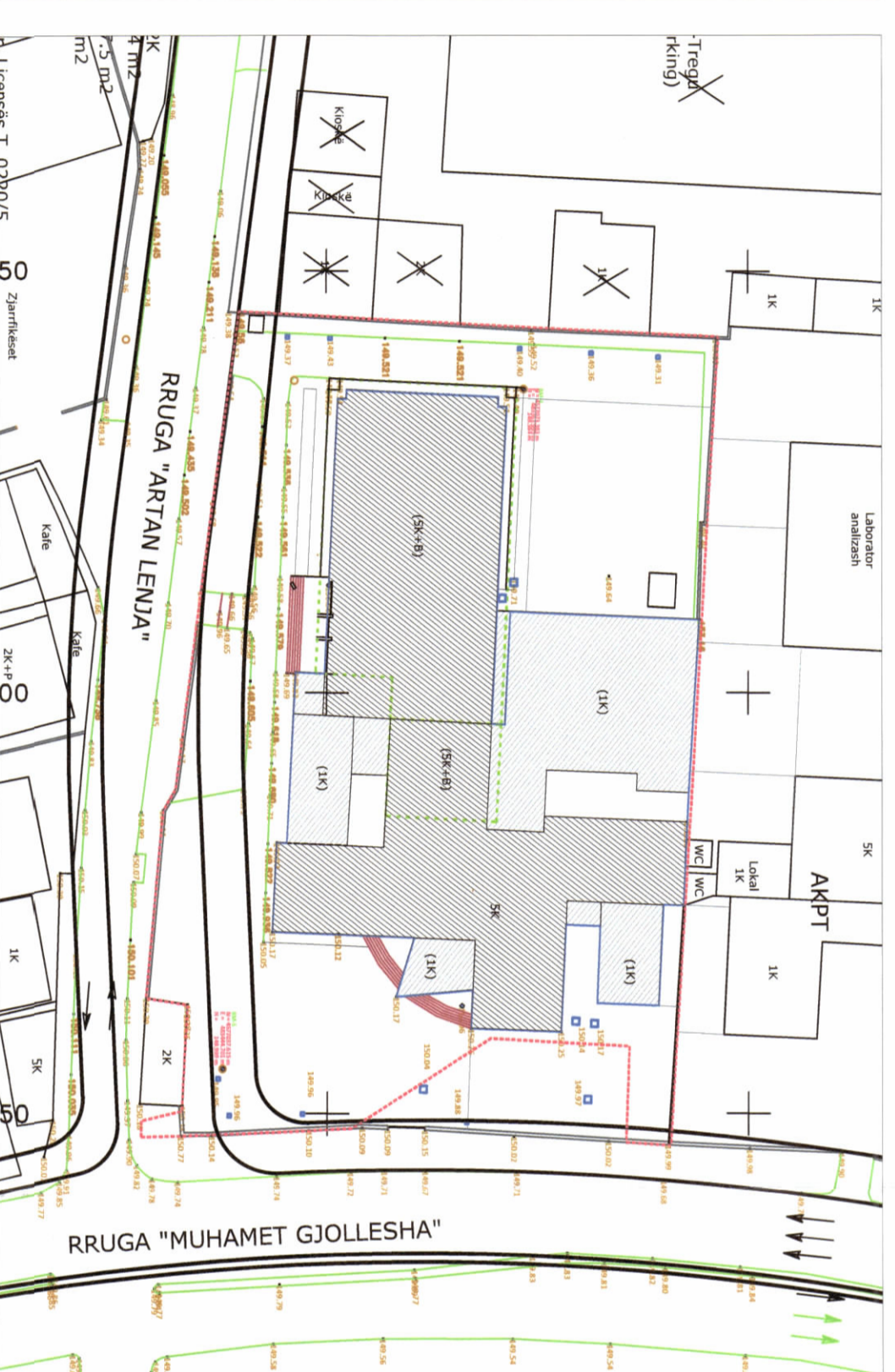
HARTA TOPOGRAFIKE SHK. 1:750