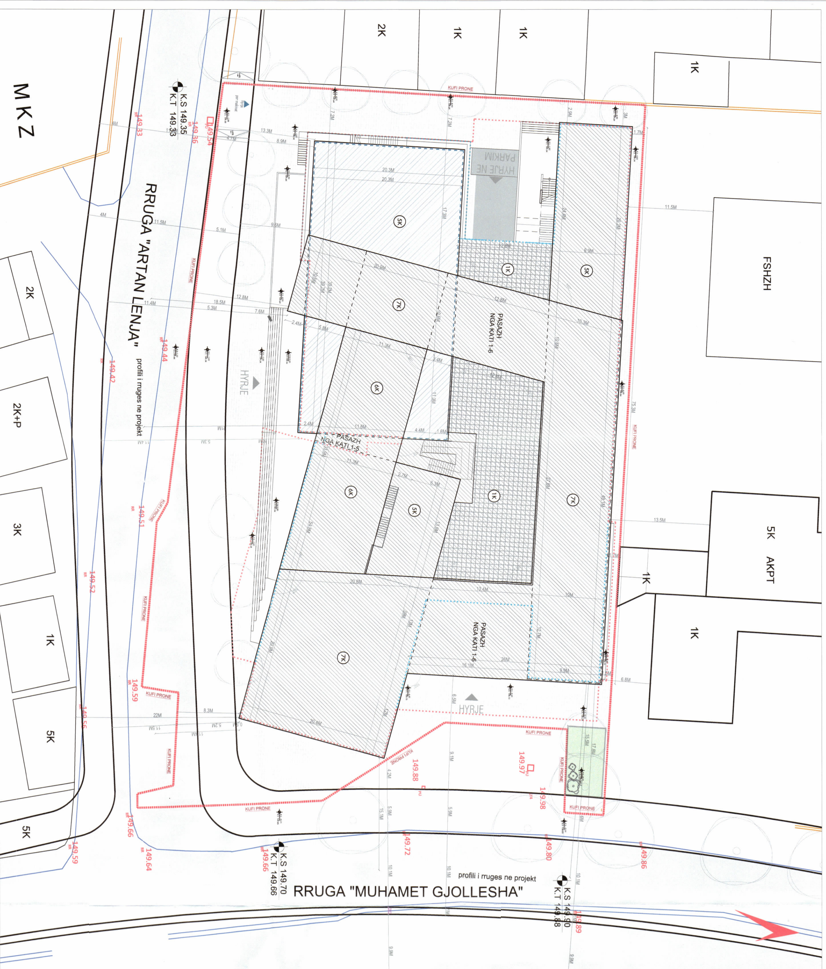
PLANI I VENDOSJES SË STRUKTURËS SHK. 1: 300

SHKALLA 1: 300 NR. I FLETËS A-01 NR. I KOPJEVE 02/06