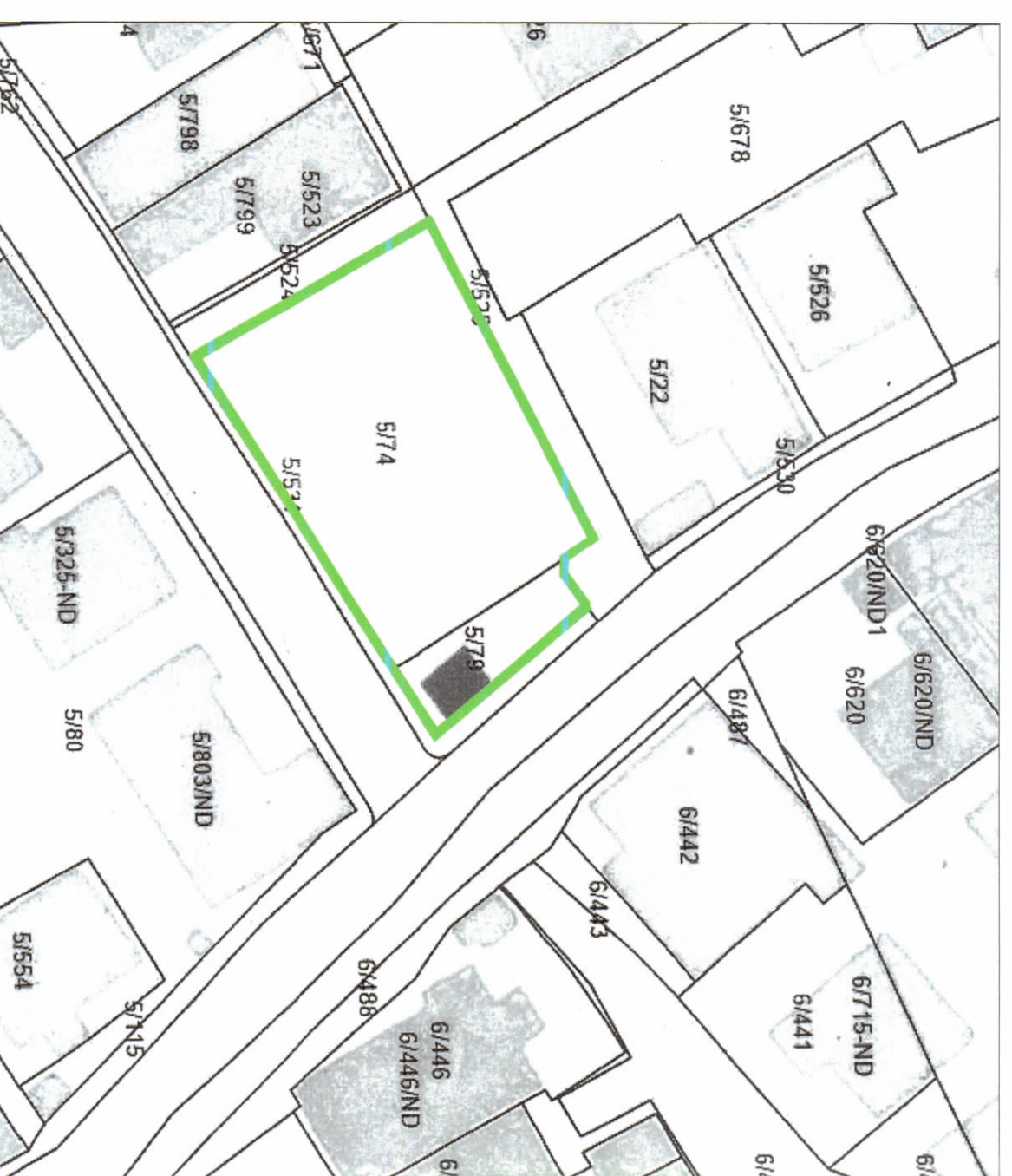
POZICIONI KADASTRAL SHK. 1:500