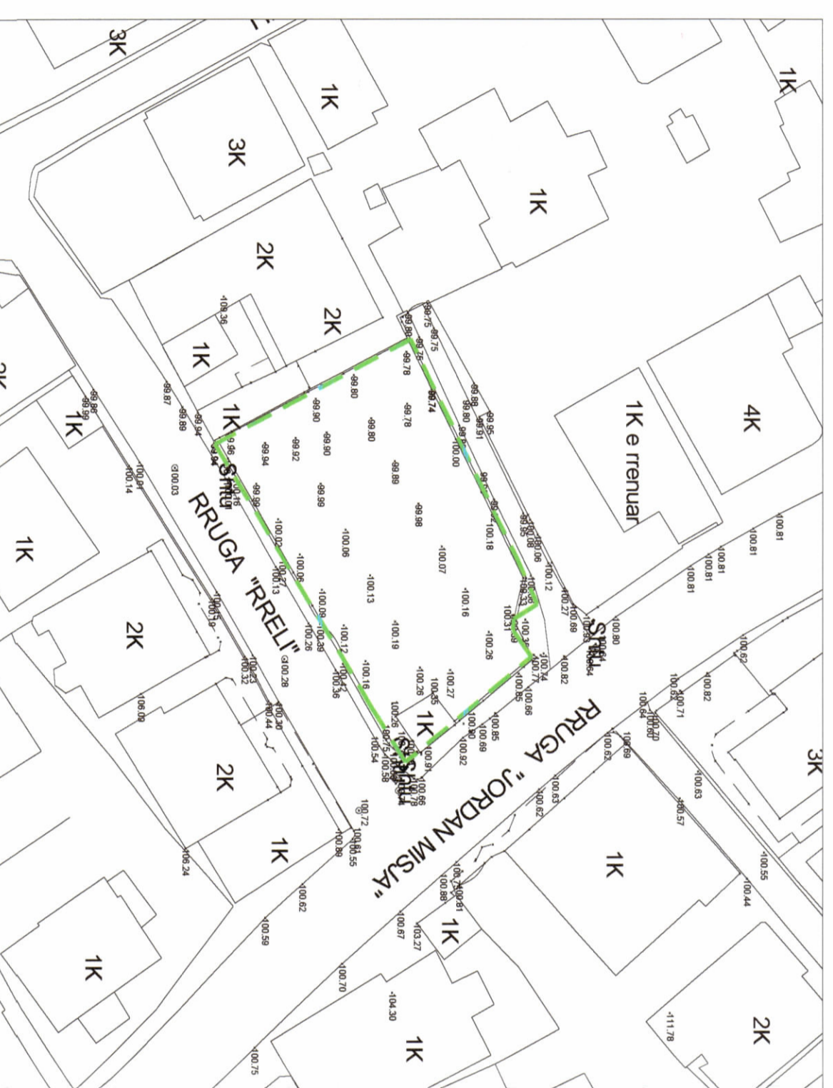
HARTA TOPOGRAFIKE SHK. 1:500