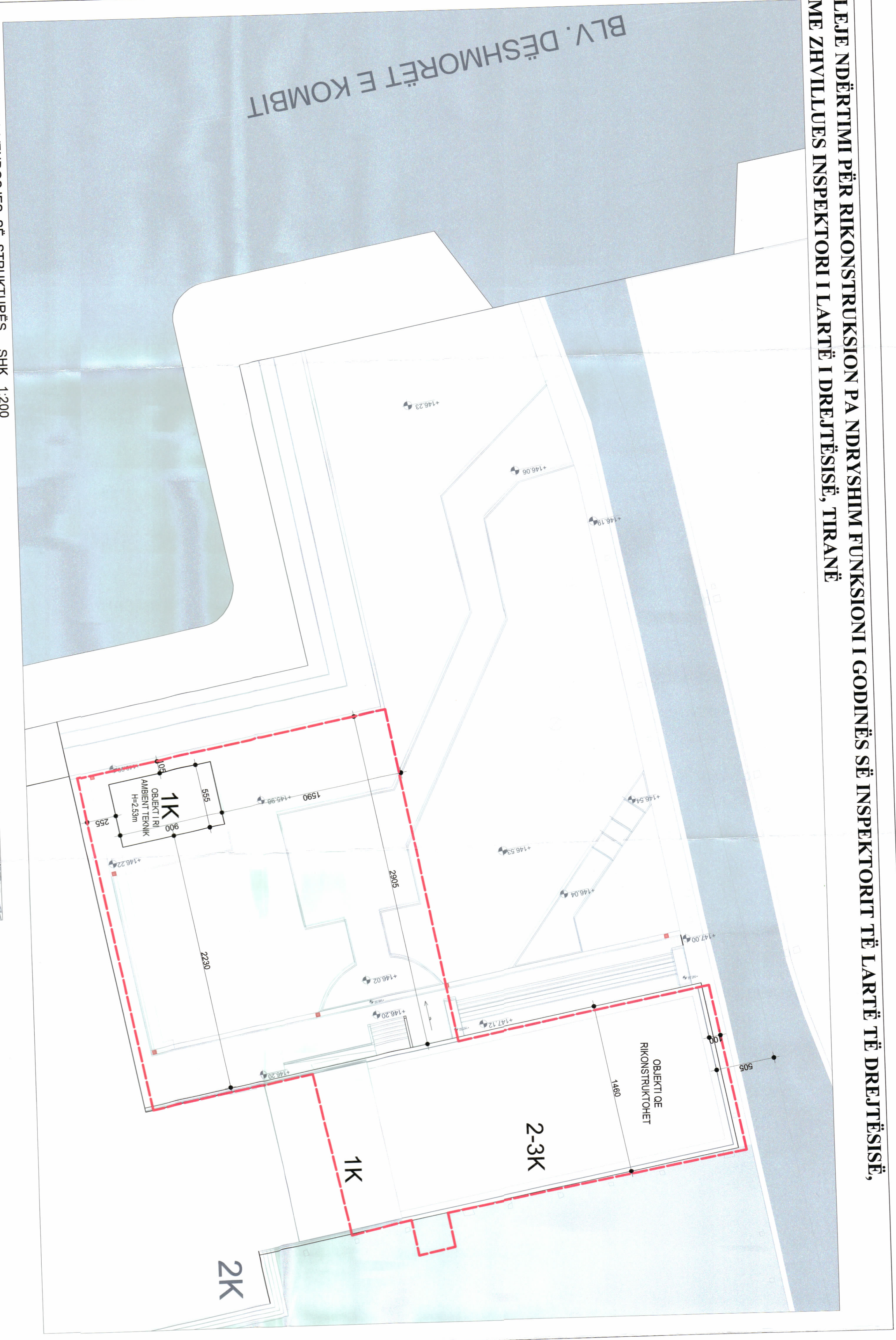
PLANI I VENDOSJES SË STRUKTURËS SHK. 1:200