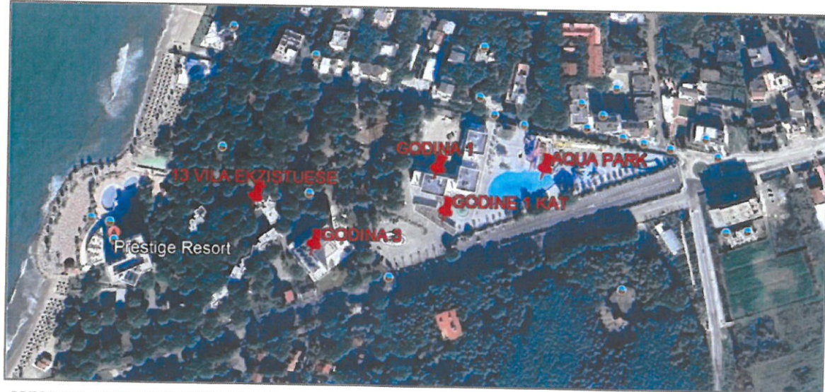
ORTOFOTO E VENDODHJES SE OBJEKTIT SHK. 1:2000