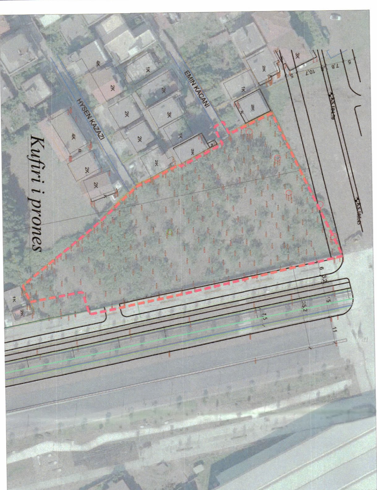
HARTA TOPOGRAFIKE SHK. 1:1000