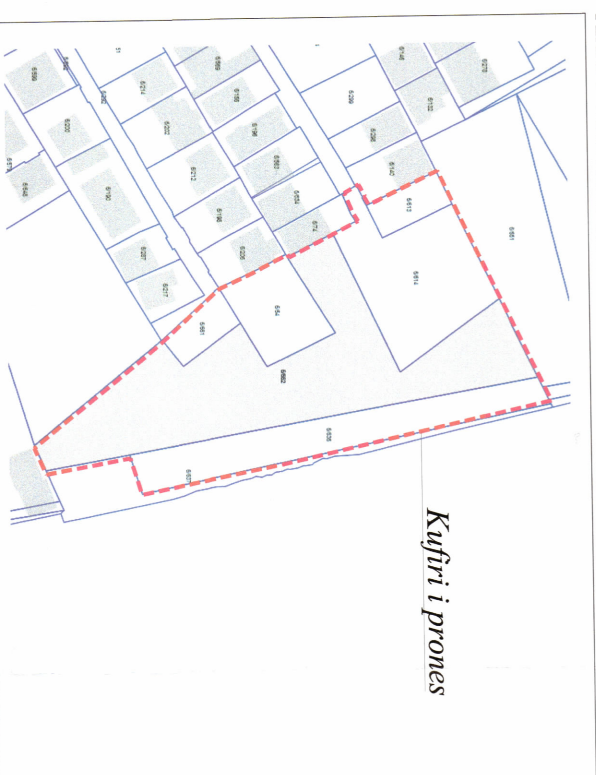
POZICIONI KADASTRAL SHK. 1:1000