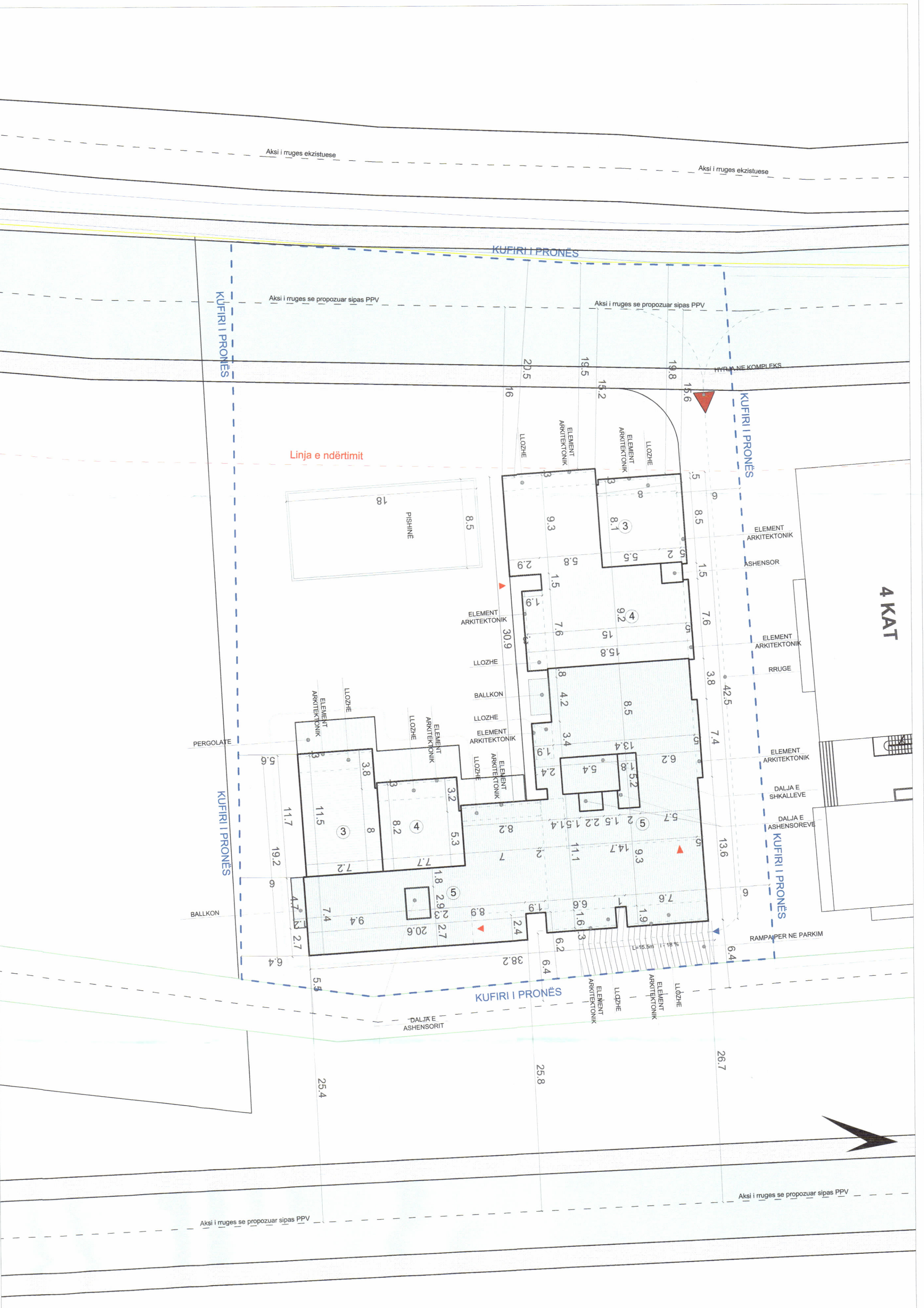
PLANI I VENDOSJES SË STRUKTURËS SHK. 1: 200