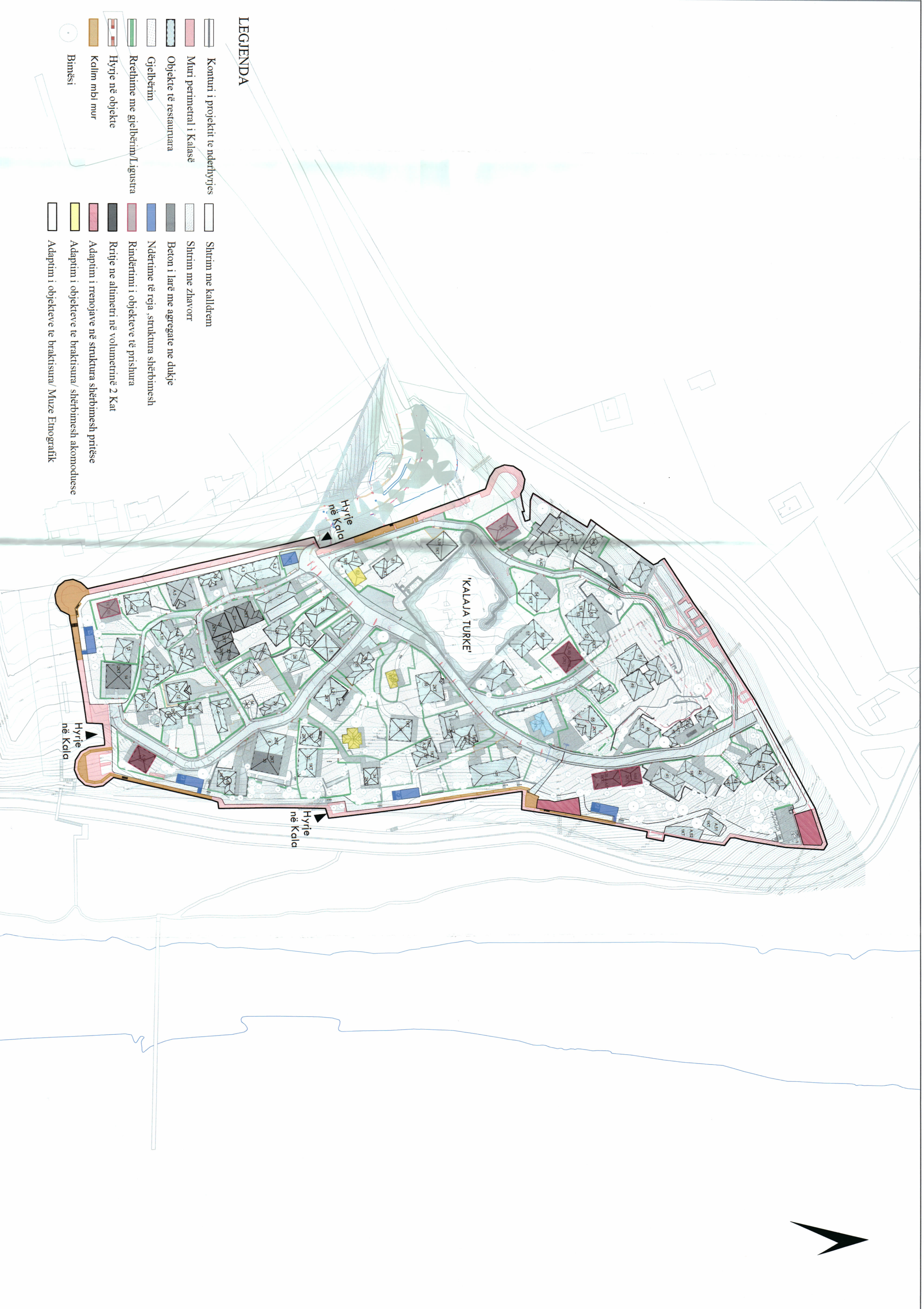
PLANI I VENDOSJES SË STRUKTURËS SHK. 1: 1000

Per prorat të cilit figuron në planin informacionial pasurim/privat të pavetëdijshëm, në rast se do të ketë regjistruar të reja, do të pasqyrohen në lejen e ndërtimit. 1. Prorat shtet: Zona Kadastrale: 3574 Nr. Pasurim: 9/13, 12/137, 9/265, 9/9/95, 9/36, 9/35, 9/37, 9/58, 9/209, 9/285, 9/91, 9/92, 9/224, 9/171, 9/106, 9/195, 9/222, 9/200, 9/156, 9/108, 9/150, 9/128, 9/157, 9/134, 9/135, 9/139, 9/191, 9/192, 9/197, 9/193, 9/152, 9/165, 9/181, 9/28, 9/60, 9/61, 9/50, 9/48, 9/49, 9/39, 9/37, 9/67, 9/36, 9/8, 9/265, 9/24, 9/20, 9/19, 9/31, 9/19, 9/26, 9/25, 9/27, 9/35, 9/59, 9/207, 9/208, 9/72, 9/71, 9/88, 9/89, 9/85, 9/84, 9/285, 9/214, 9/91, 9/92, 9/186, 9/193, 9/134, 9/222, 9/185, 9/189, 9/171, 9/145, 9/106, 9/166, 9/165, 9/161, 9/224, 9/168, 9/168, 9/168, 9/168, 9/168, 9/168, 9/253, 9/221, 9/130. 2. Prona Private: Zona Kadastrale: 3574 Nr. Pasurim: 9/13, ND1, 9/13, ND2, 9/91, ND, 9/185, ND, 9/128, ND, 9/157, ND, 9/134, ND, 9/100, 9/101, 9/14, 9/48, ND1, 9/48, ND2, 9/5, ND, 9/68, ND, 9/86, 9/91, ND, 9/194, 9/134, ND, 9/185, ND, 9/174, ND, 9/172, 9/155, 9/80, 9/78, ND1, 9/78, ND2, 9/58, ND, 9/66, ND, 9/66, ND, 9/150, ND, 9/145, 9/191, 9/30, ND. 3. Prona Private me Pronatë të Pavetëdijshme: Zona Kadastrale: 3574 Nr. Pasurim: 9/11, 9/10, 9/62, 9/22, 9/34, 9/202, 9/86, 9/94, 9/95, 9/223, 9/70, 9/189, 9/190, 9/192, 9/55, 9/51, 9/52, 9/38, 9/21, 9/22, 9/34, 9/86, 9/223, 9/159, 9/162, 9/163, 9/32, 9/173