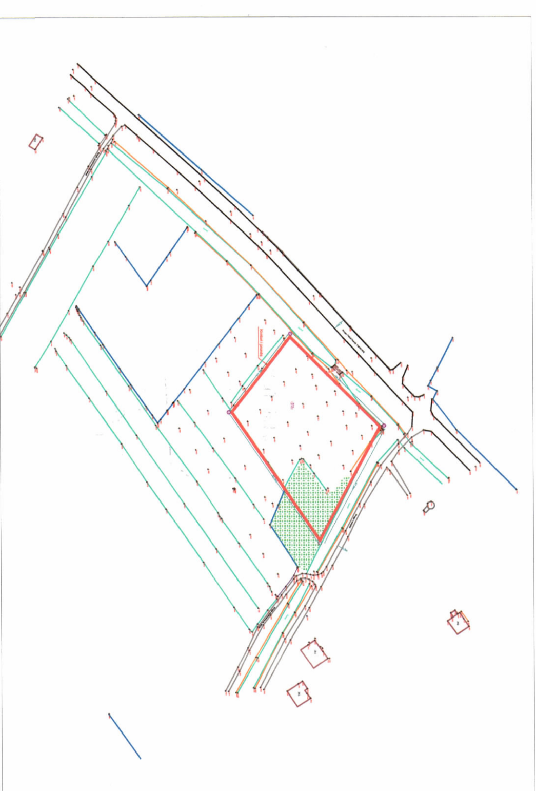
AZHORNIMI TOPOGRAFIK SHK. 1:2000