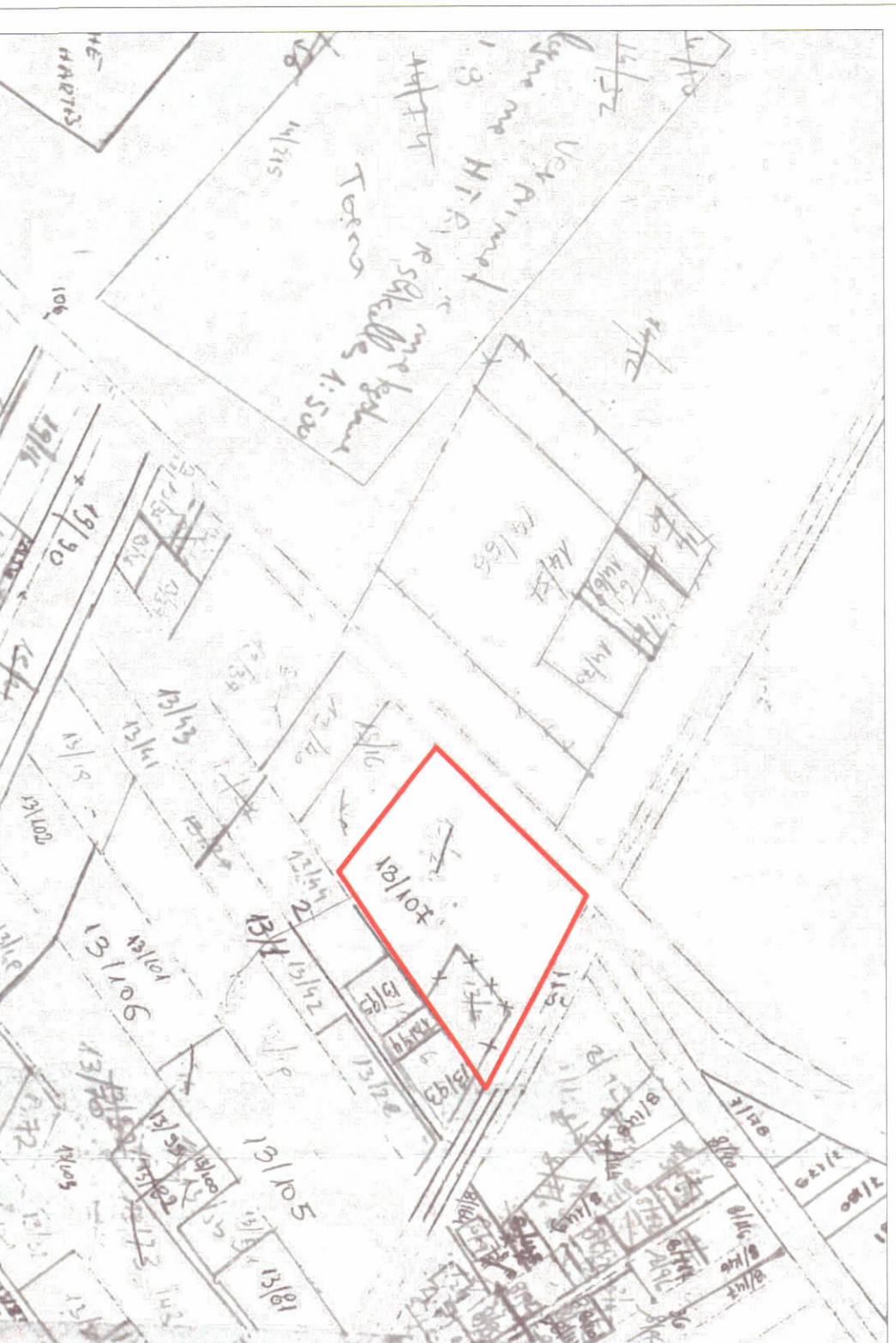
POZICIONI KADASTRAL SHK. 1:2000