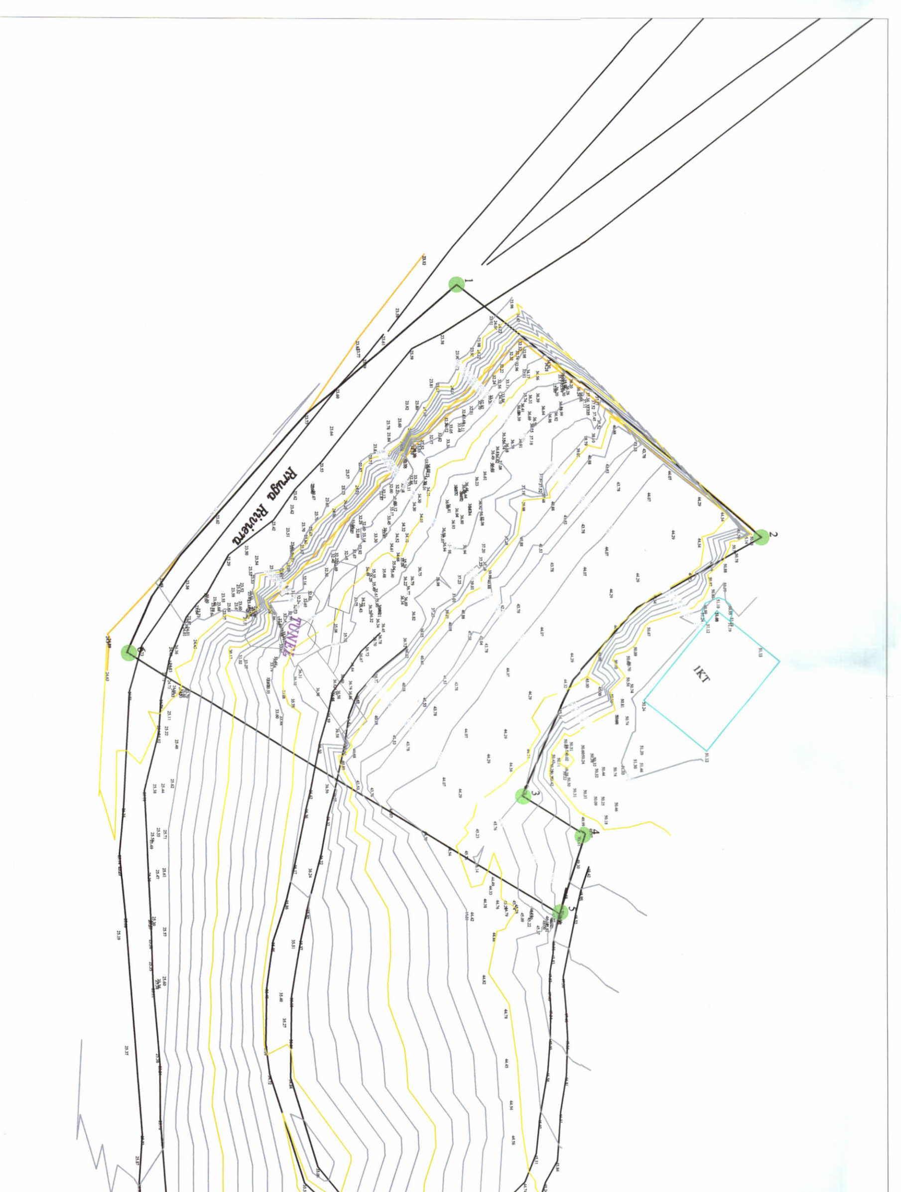
HARTA TOPOGRAFIKE SHK. 1:500