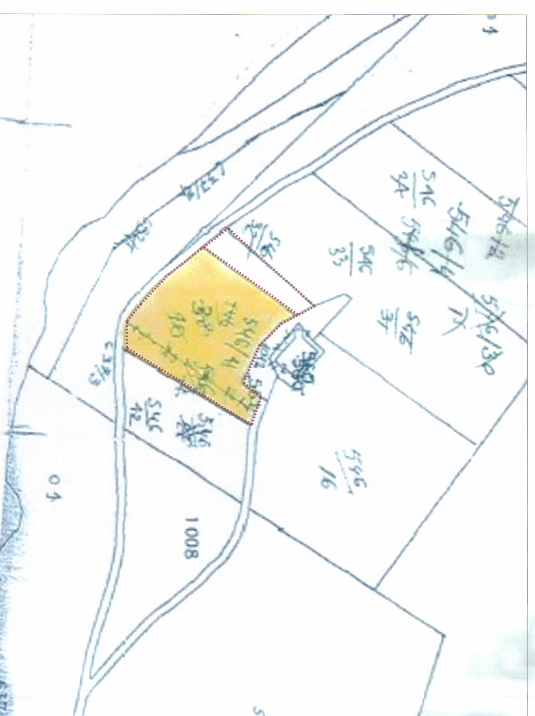
POZICIONI KADASTRAL SHK. 1:1000