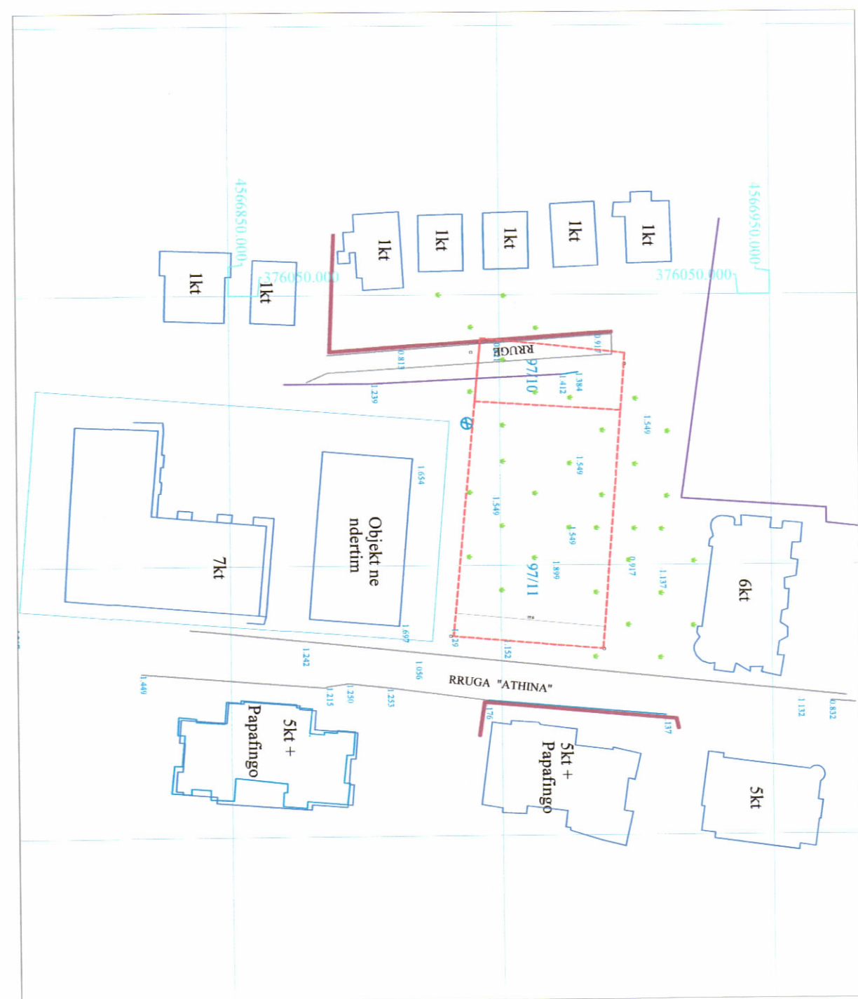
HARTA TOPOGRAFIKE SHK. 1:1000