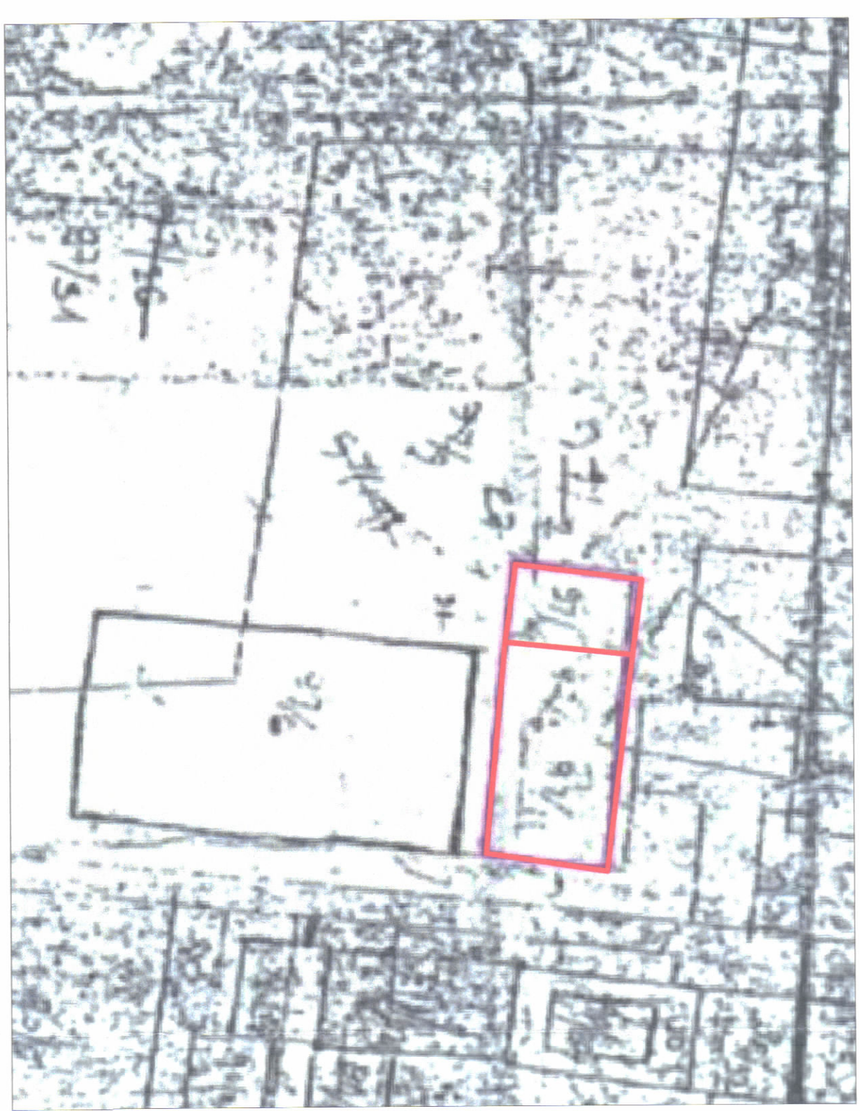
POZICIONI KADASTRAL, SHK. 1:1000