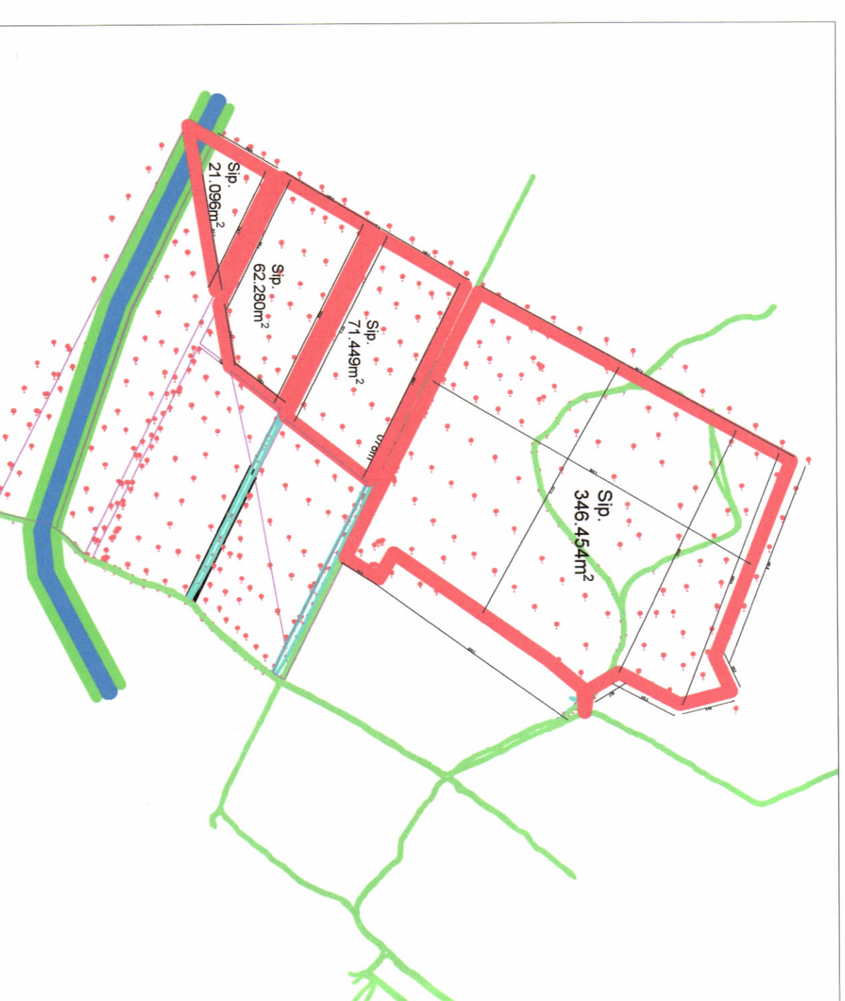
HARTA TOPOGRAFIKE SHK. 1:1000