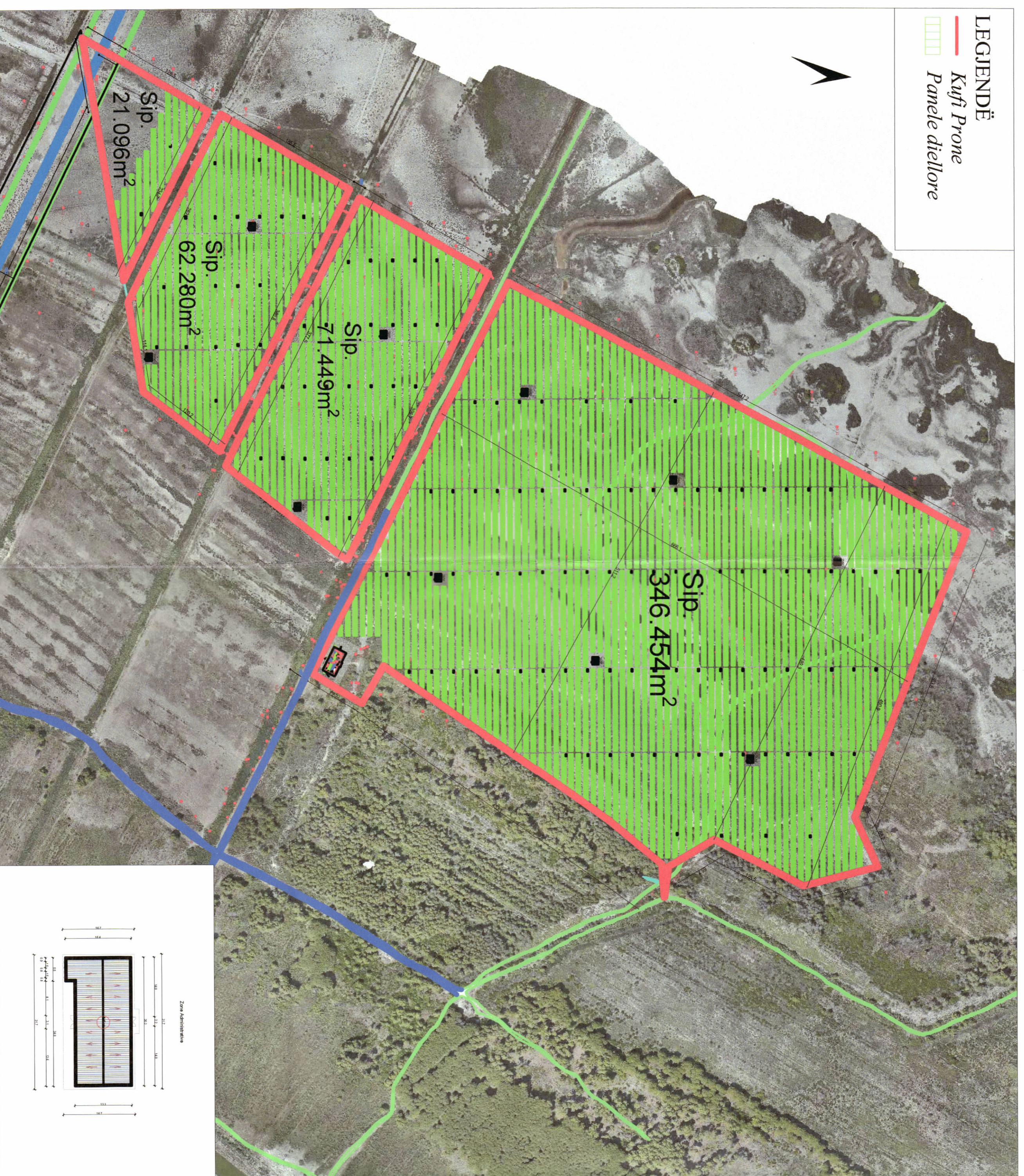
PLANI I VENDOSIES SË STRUKTURËS SHK. 1:500

Miratar me Vendim të KKT Nr. 13, Datë 08/03/2023