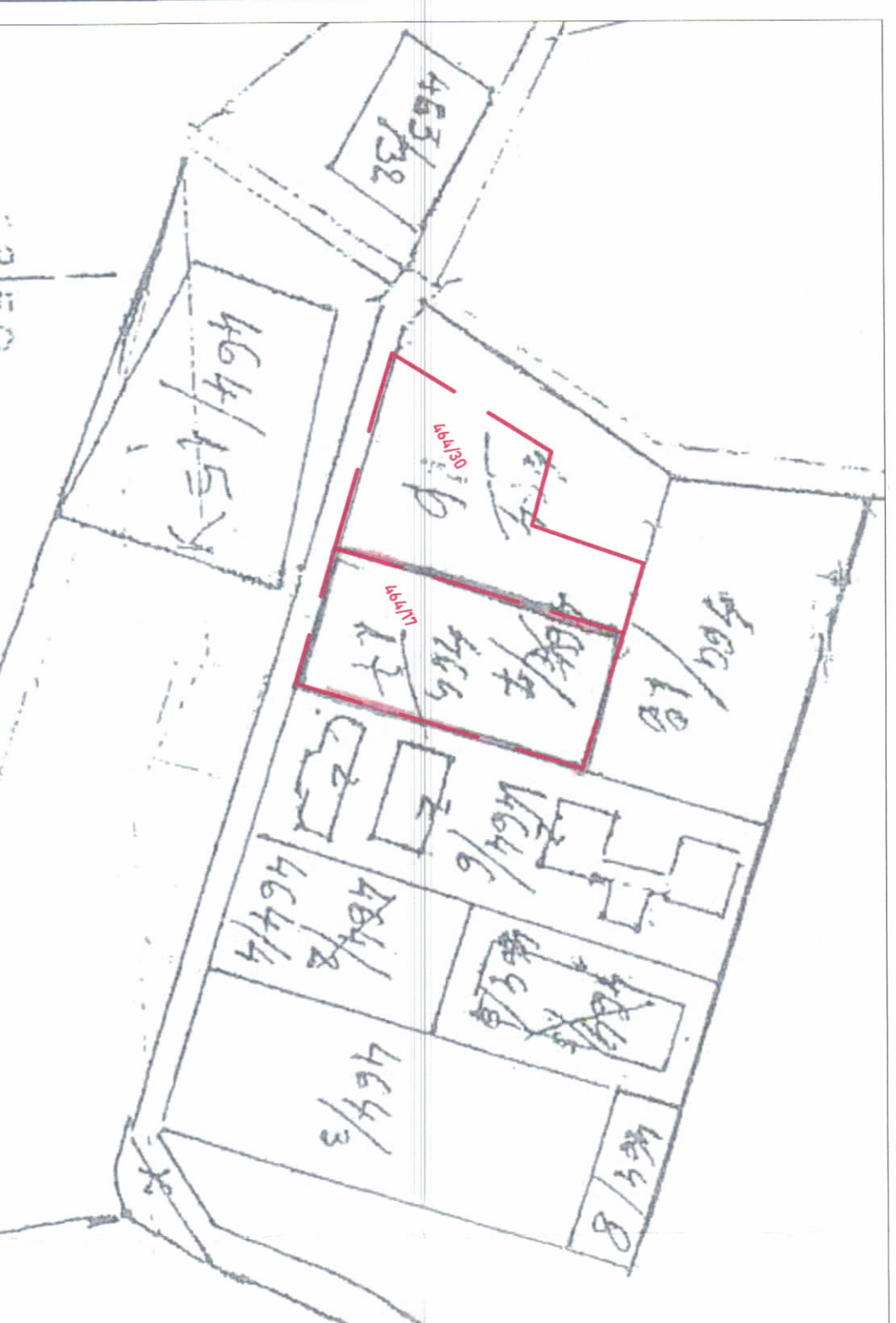
POZICIONI KADASTRAL SHK. 1:1000