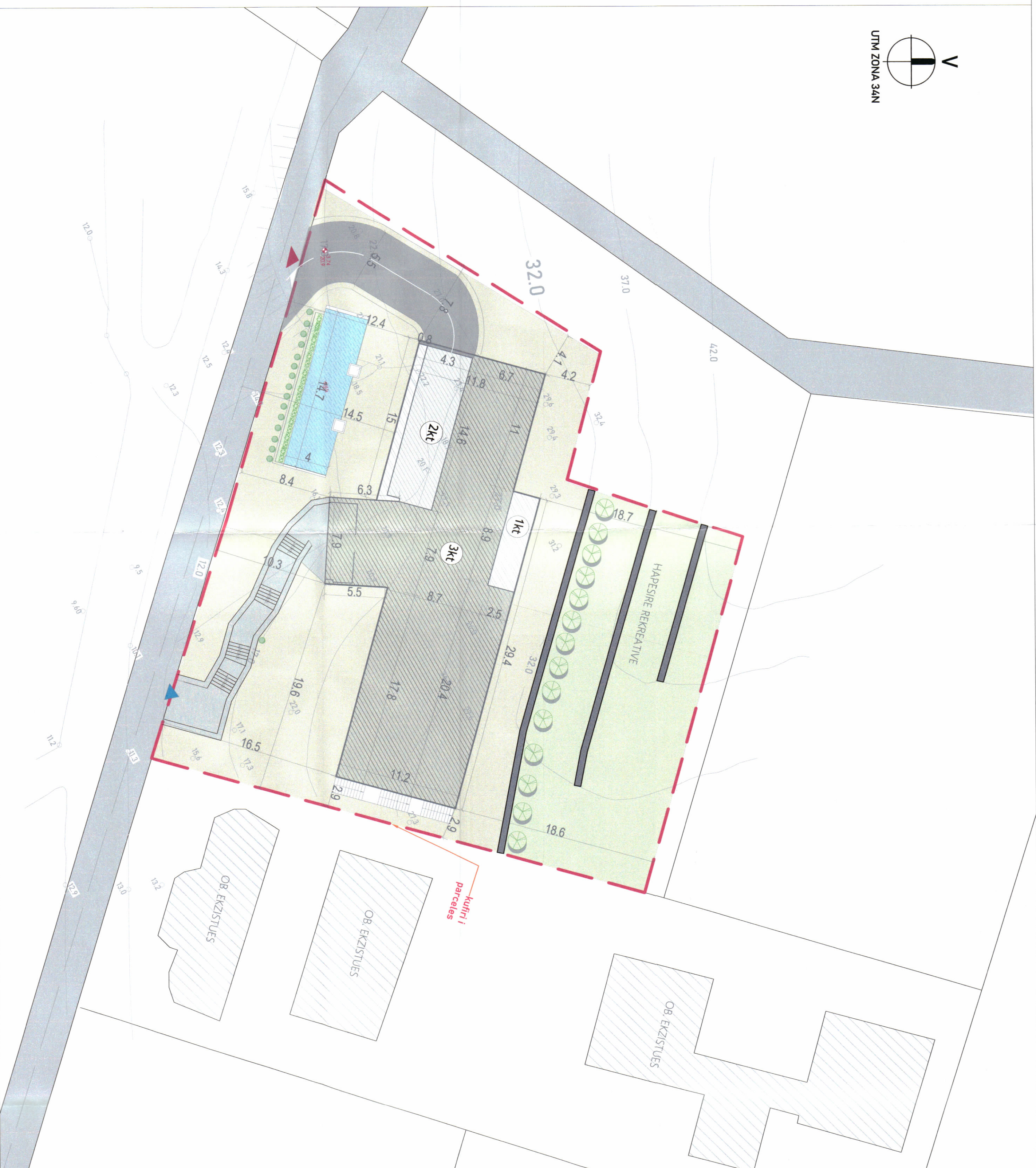
PLANI I VENDOSJES SË STRUKTURËS SHK. 1: 250