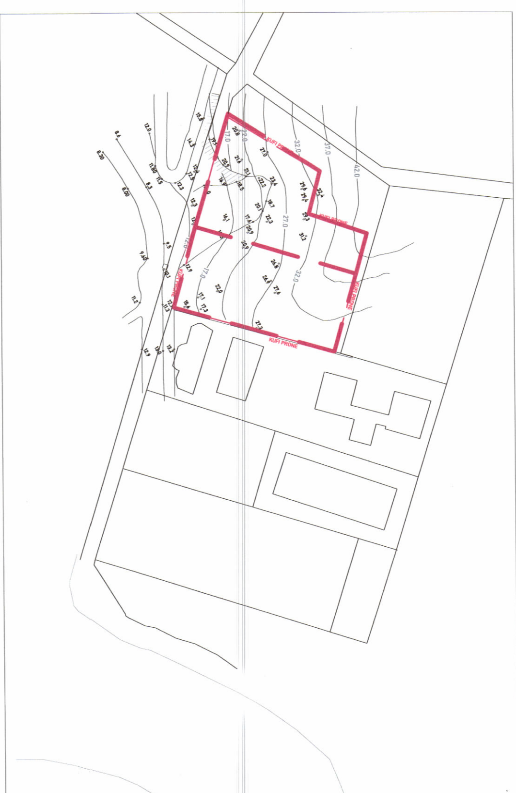
HARTA TOPOGRAFIKE SHK. 1:1000