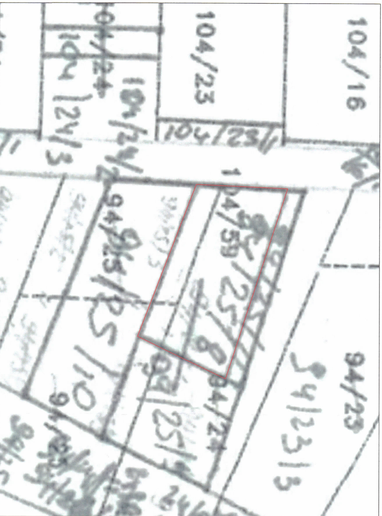
POZICIONI KADASTRAL SHK. 1:500