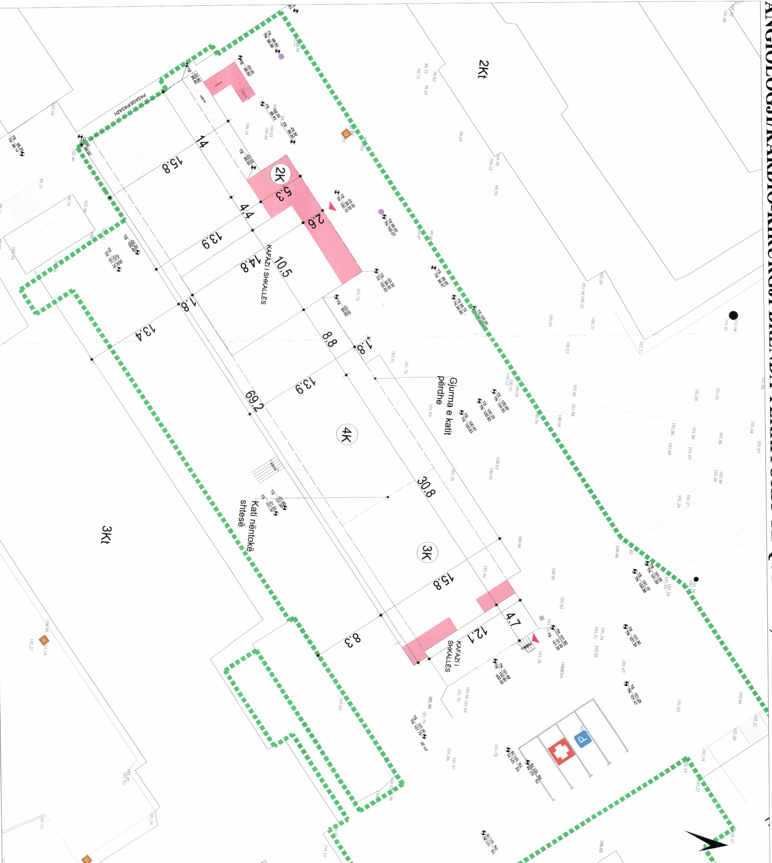
PLANI I VENDOSJES SË STRUKTURËS SHK. 1:250