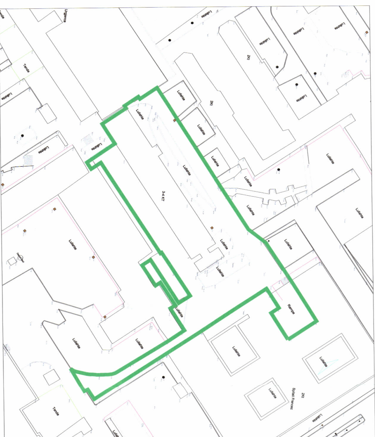
HARTA TOPOGRAFIKE SHK. 1:1000