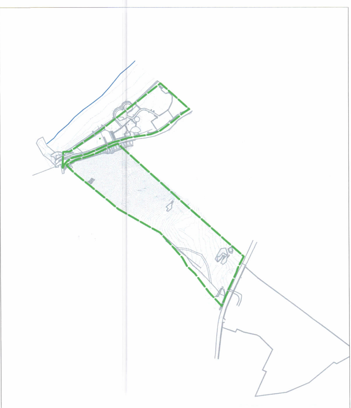
HARTA TOPOGRAFIKE SHK. 1:500