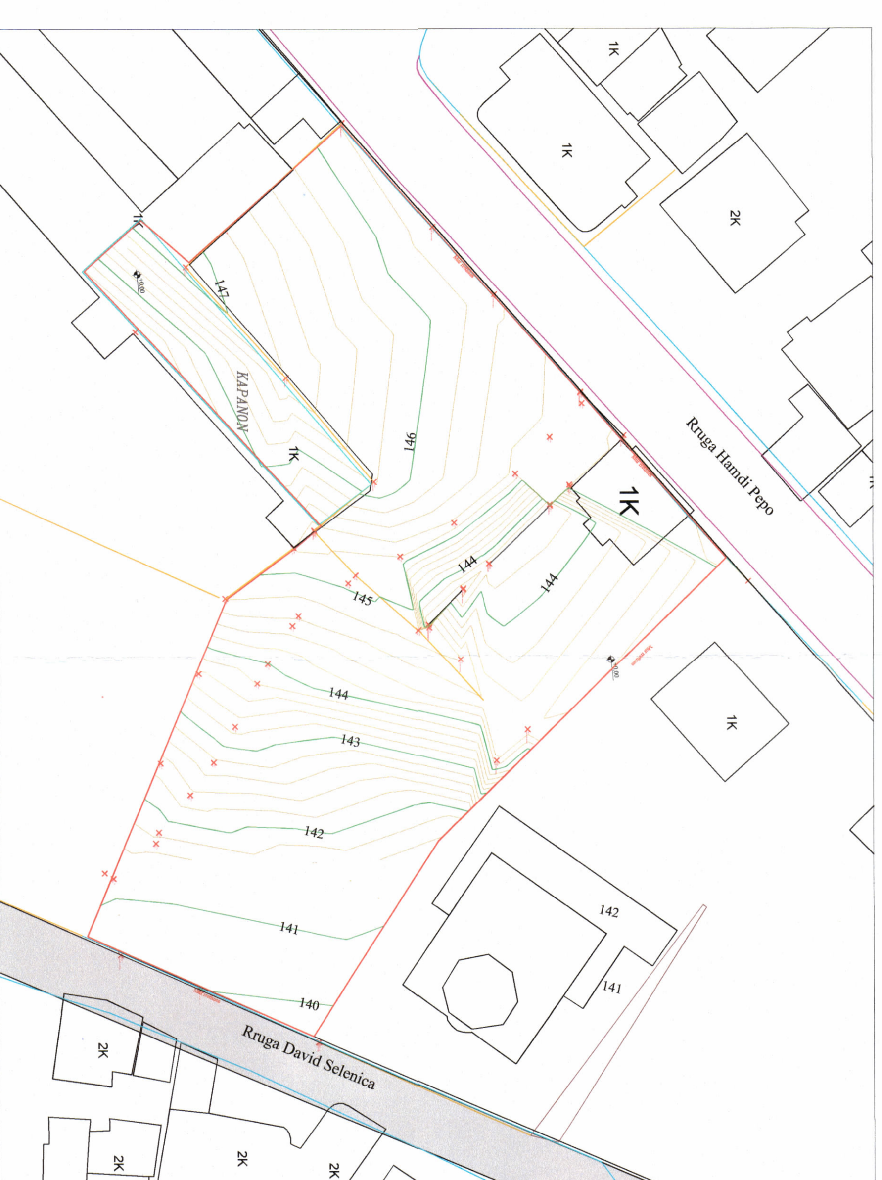
HARTA TOPOGRAFIKE SHK. 1:400

TREQËSIT E ZHVILLIMIT: Sipërfaqe e përgjithshme e truallit: 3.452,56 m 2 Sipërfaqe e truallit që përdoret për zhvillim: 3.452,56 m 2 Sipërfaqe e truallit e zënë nga struktura (gjurma): 1502 m 2 Sipërfaqe e ndërimit mbi tokë: 6547 m 2 Sipërfaqe e ndërimit nën tokë: 1502 m 2 Sipërfaqe e përgjithshme e ndërimit: 8049 m 2 Koeficienti i shfrytëzimit të truallit për ndërimit: 43,50 % Intensiteti i ndërimit: 2,33 Lartësia maksimale e strukturës nga niveli i kuotës së sistemit: 22m Numri i katëve mbi tokë: 5 Numri i katëve nën tokë: 1