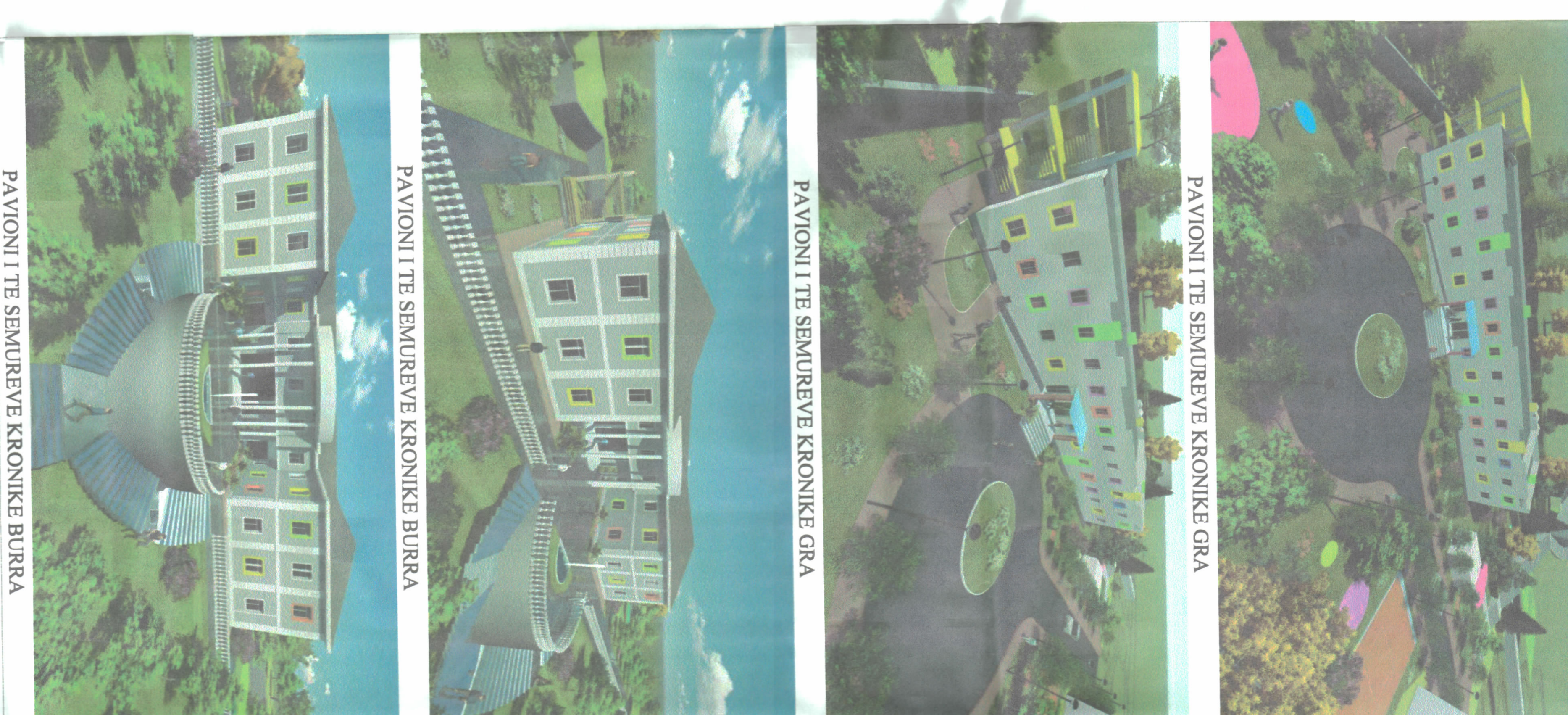
PAVIONI I TË SËMURËVE KRONIKË GRA