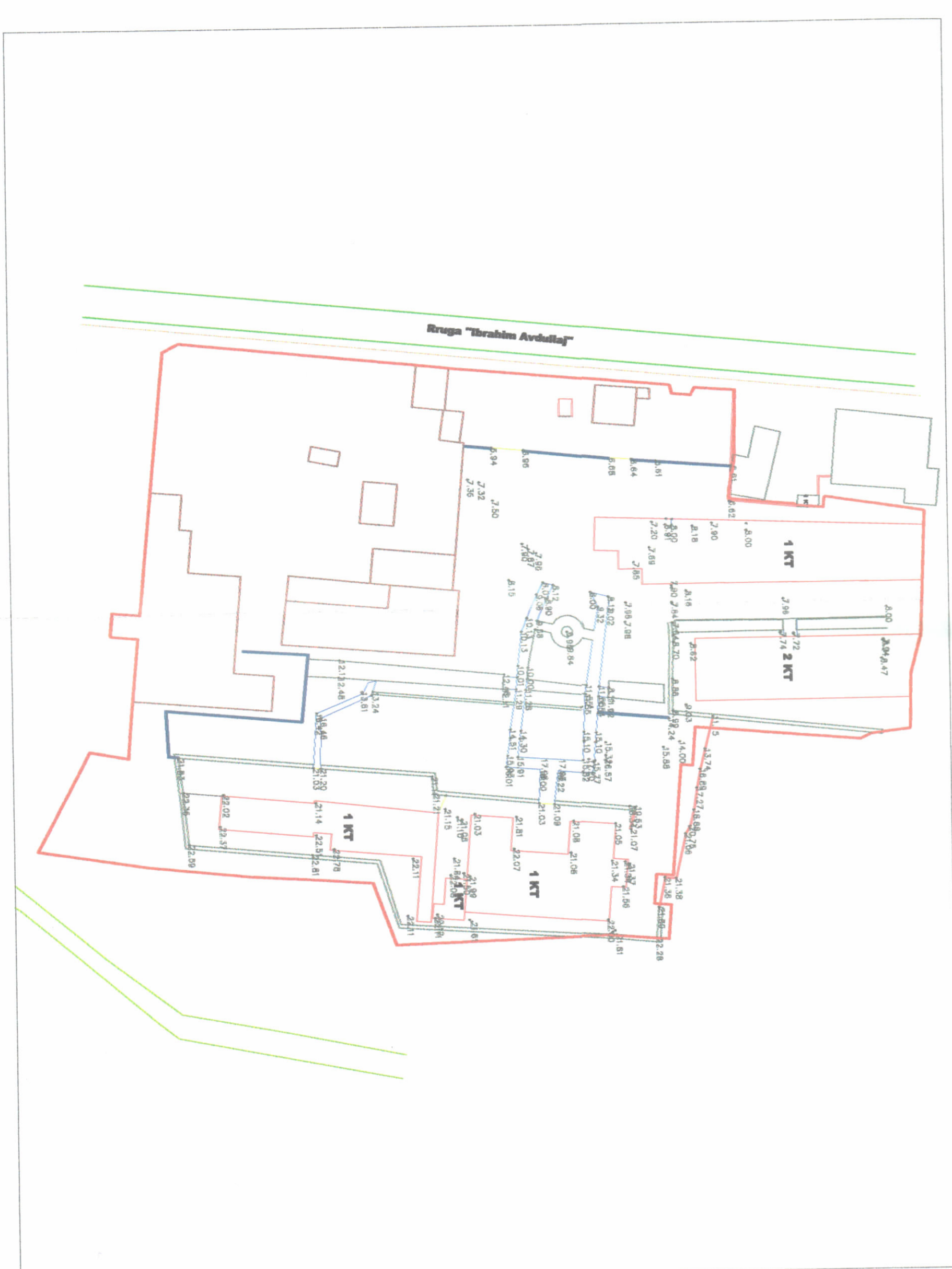
POZICIONI KADASTRAL SHK. 1:750