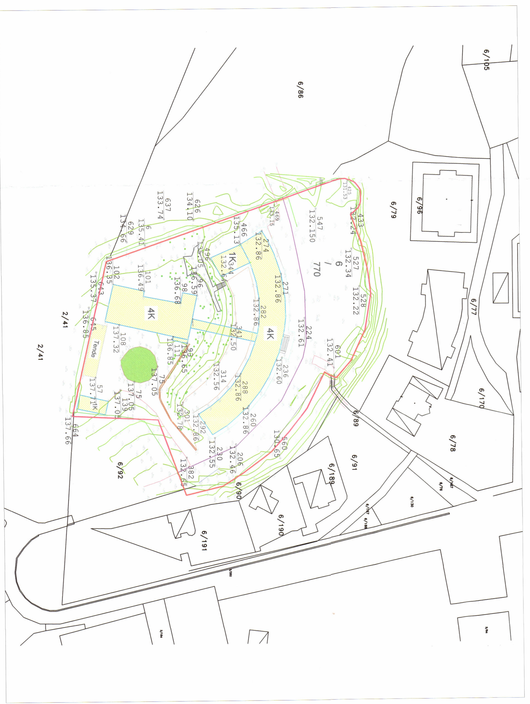
POZICIONI KADASTRAL SHK. 1:1000