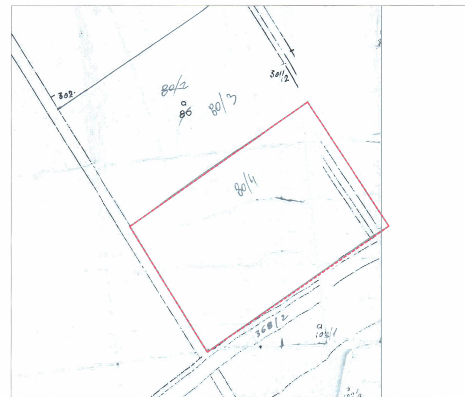
POZICIONI KADASTRAL SHK. 1:2000