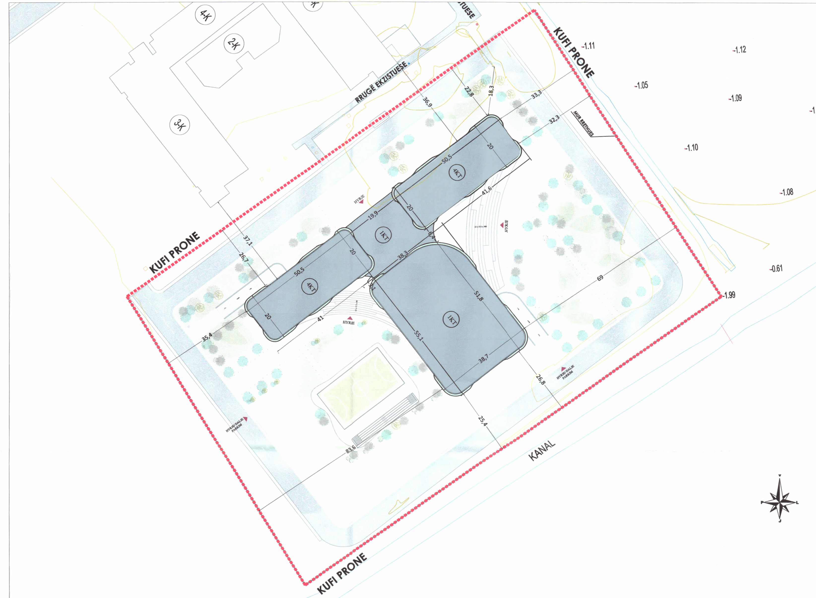
PLANI I VENDOSJES SË STRUKTURËS SHK. 1: 700