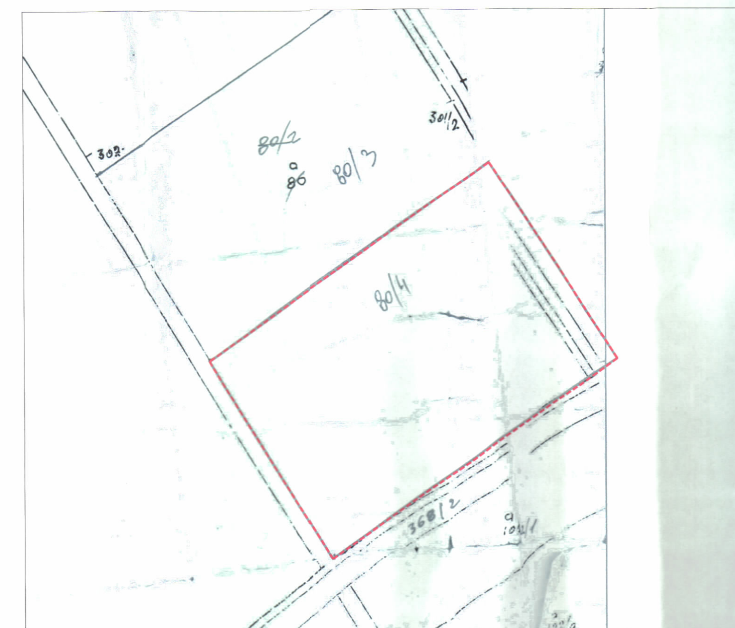
POZICIONI KADASTRAL SHK. 1:2000