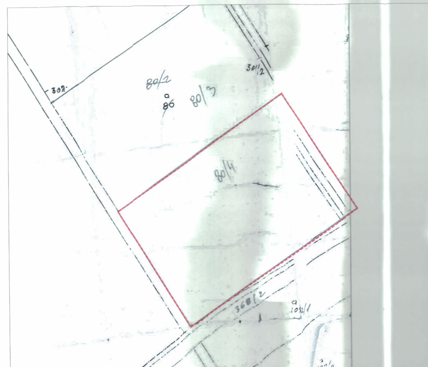
POZICIONI KADASTRAL SHK. 1:2000