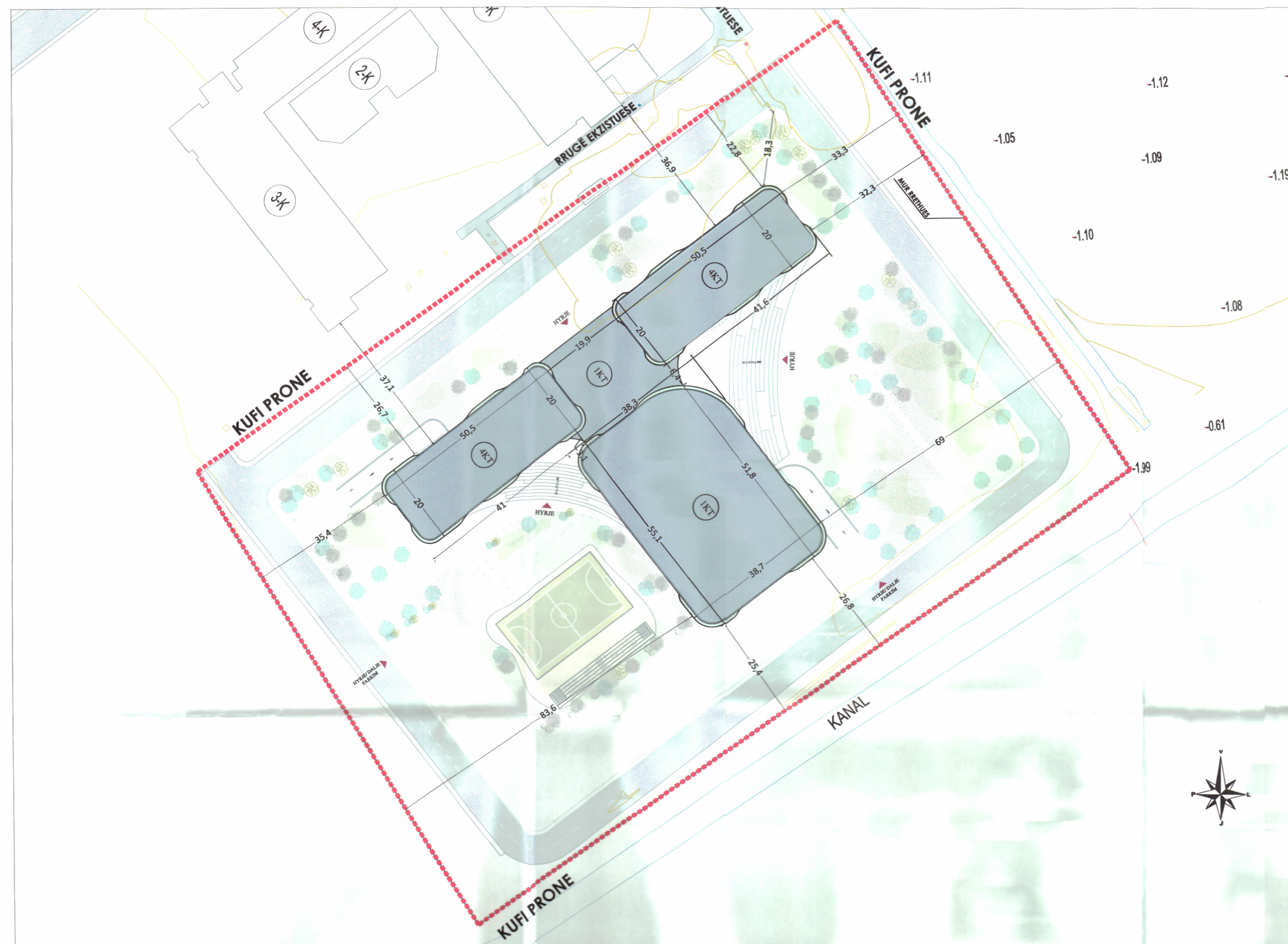
PLANI I VENDOSJES SË STRUKTURËS SHK. 1: 700