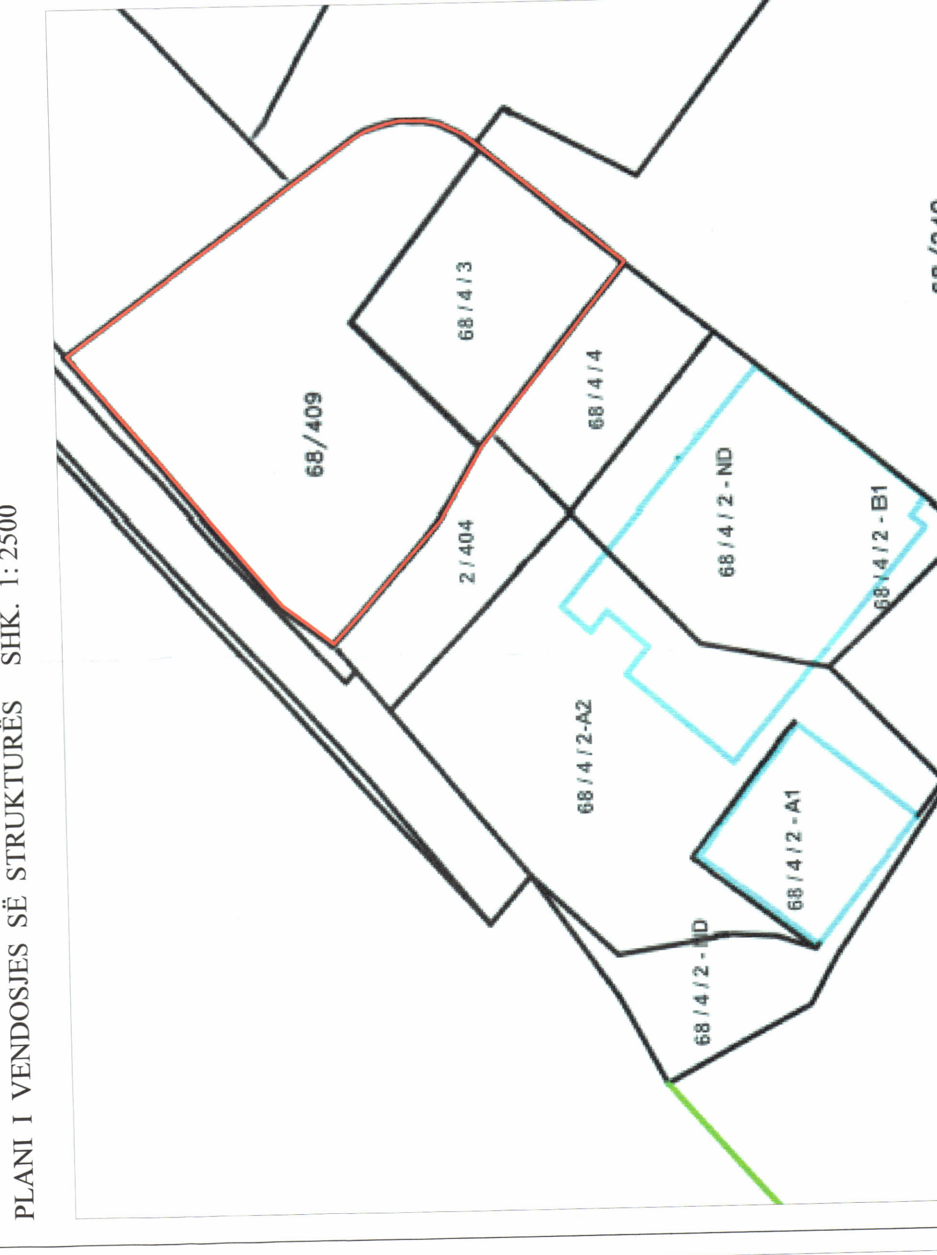
PLANI I VENDOSJES SË STRUKTURËS SHK. 1: 2500