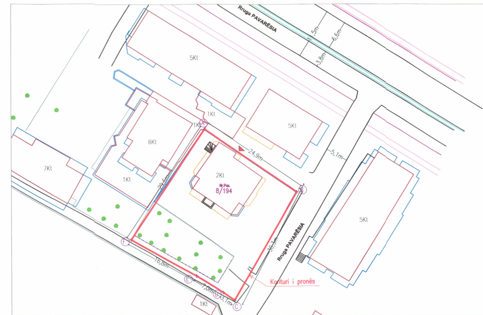
HARTA TOPOGRAFIKE SHK. 1:500