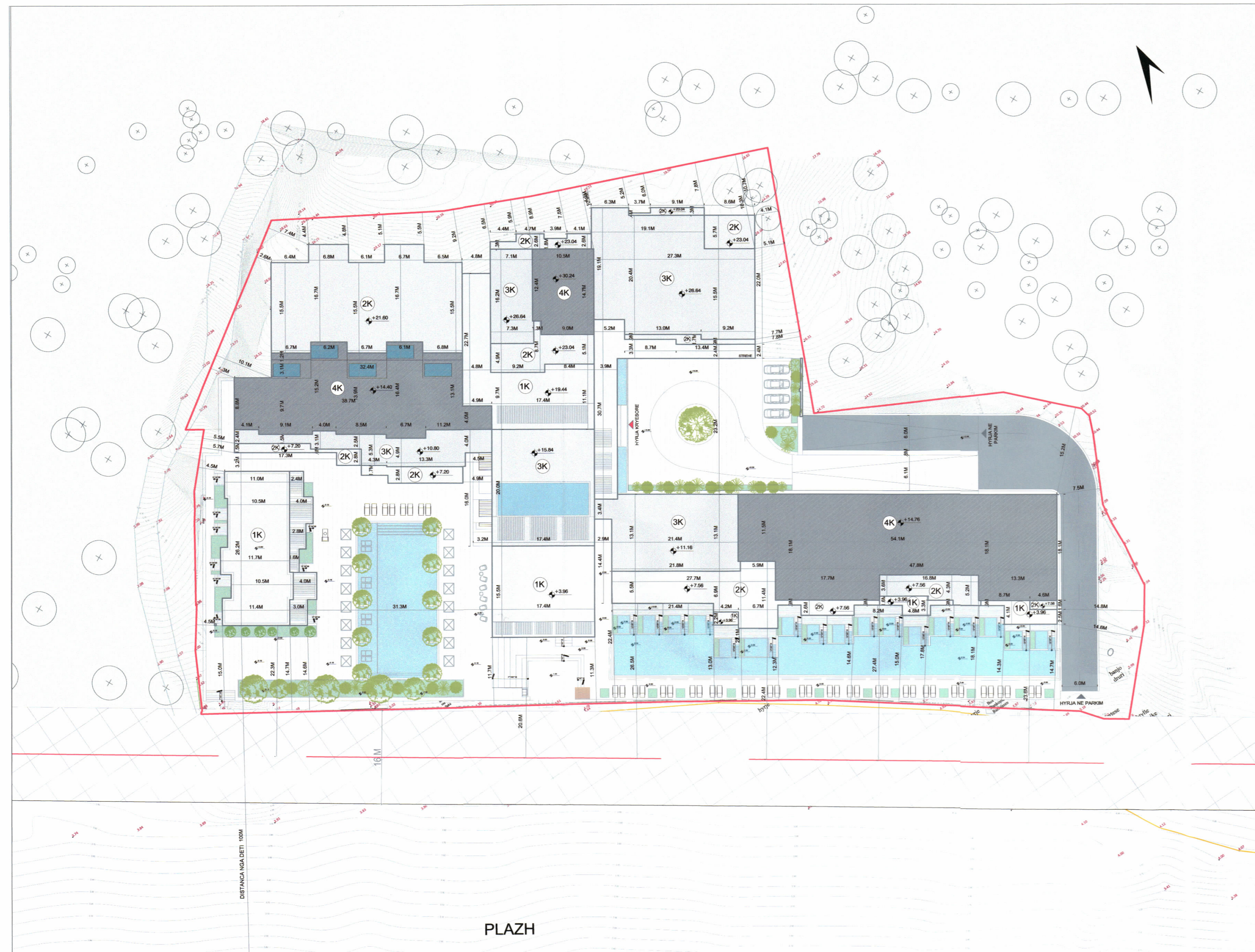
PLANI I VENDOSJES SË STRUKTURËS SHK. 1:500

Miratuar me Vendim të KKT Nr. 29, Datë 17.03.2021