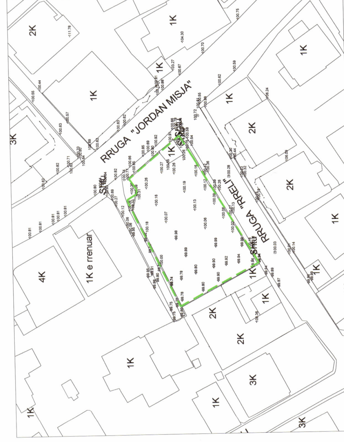
HARTA TOPOGRAFIKE SHK. 1:500