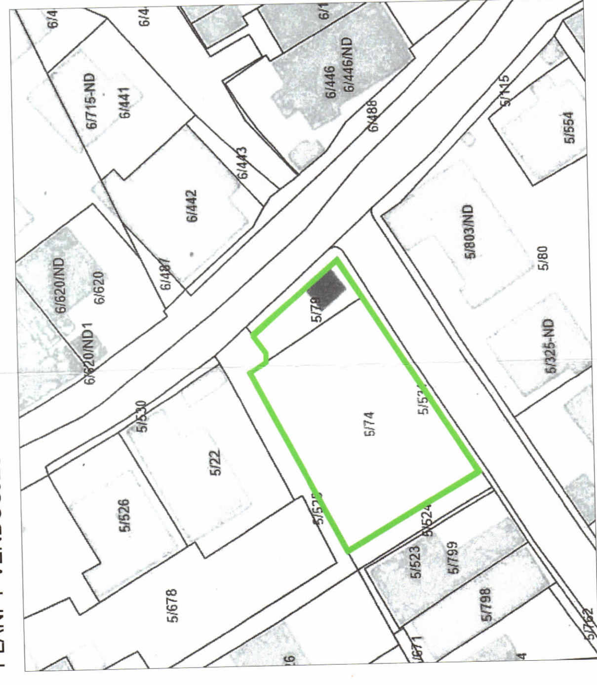
POZICIONI KADASTRAL SHK. 1:500