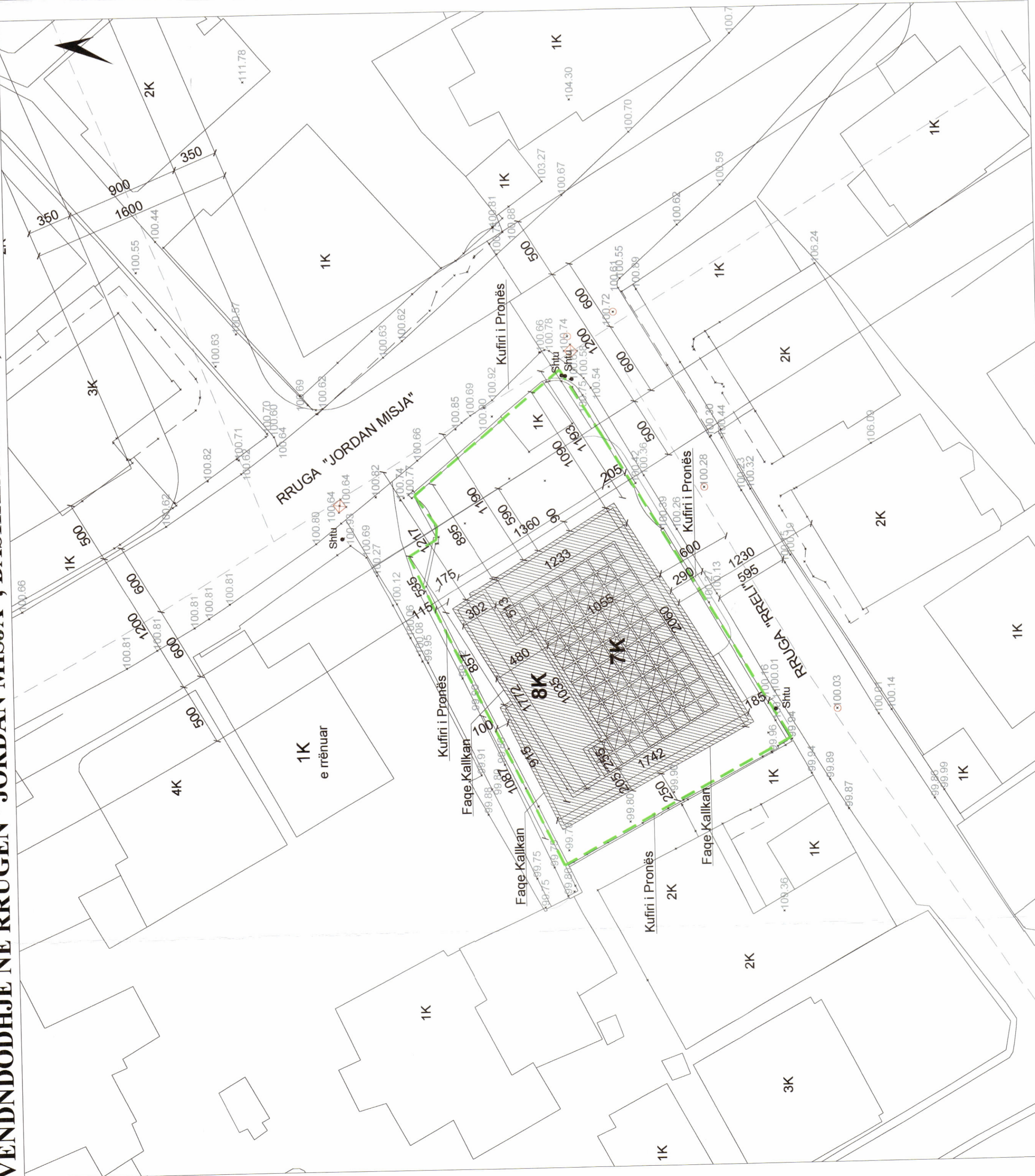
PLANI I VENDOSJES SË STRUKTURËS SHK. 1:200