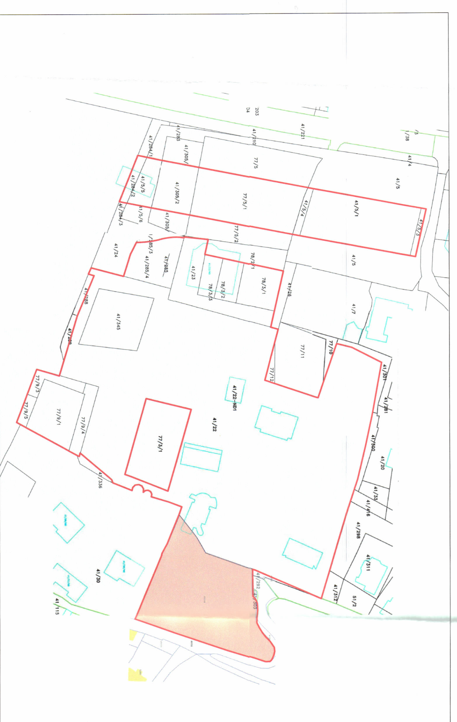
POZICIONI KADASTRAL SHK. 1:5000