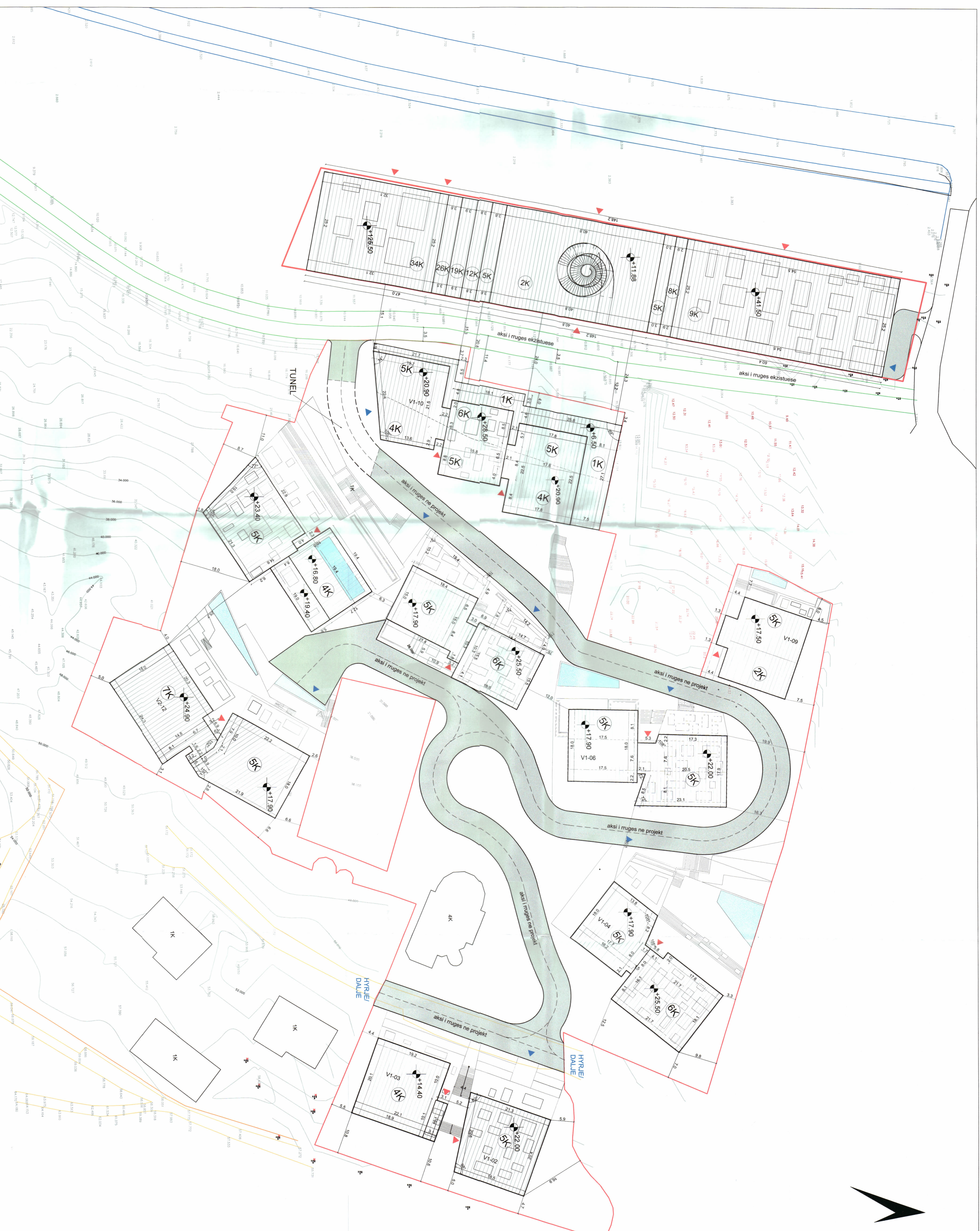
PLANI I VENDOSIES SE STRUKTURES SHK. 1: 200