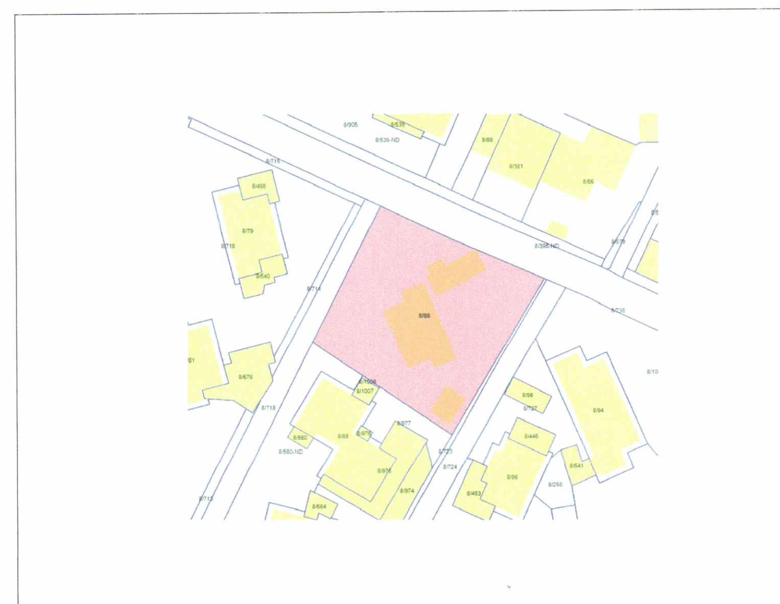
POZICIONI KADASTRAL SHK. 1:750