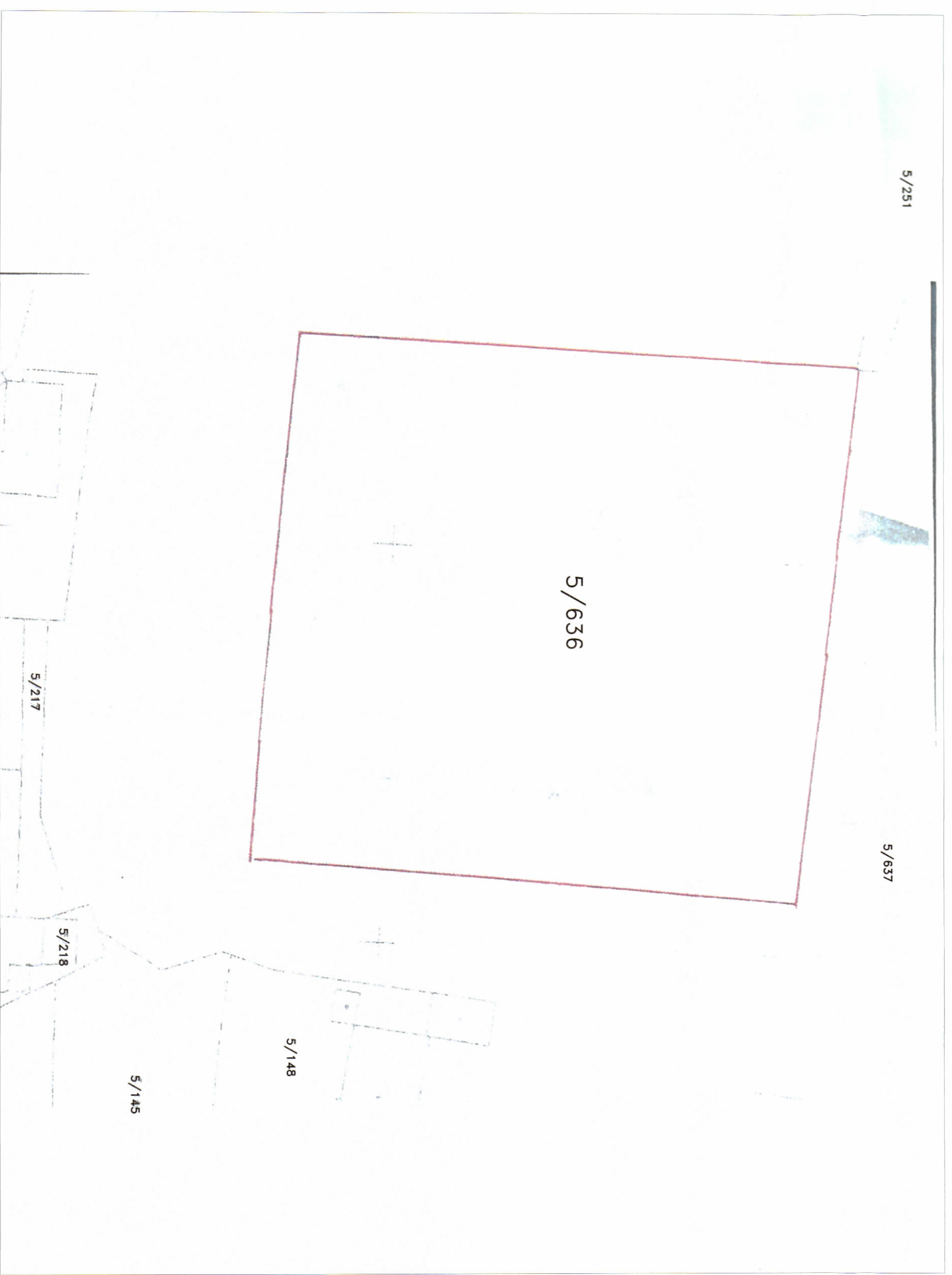
POZICIONI KADASTRAL SHK. 1:500