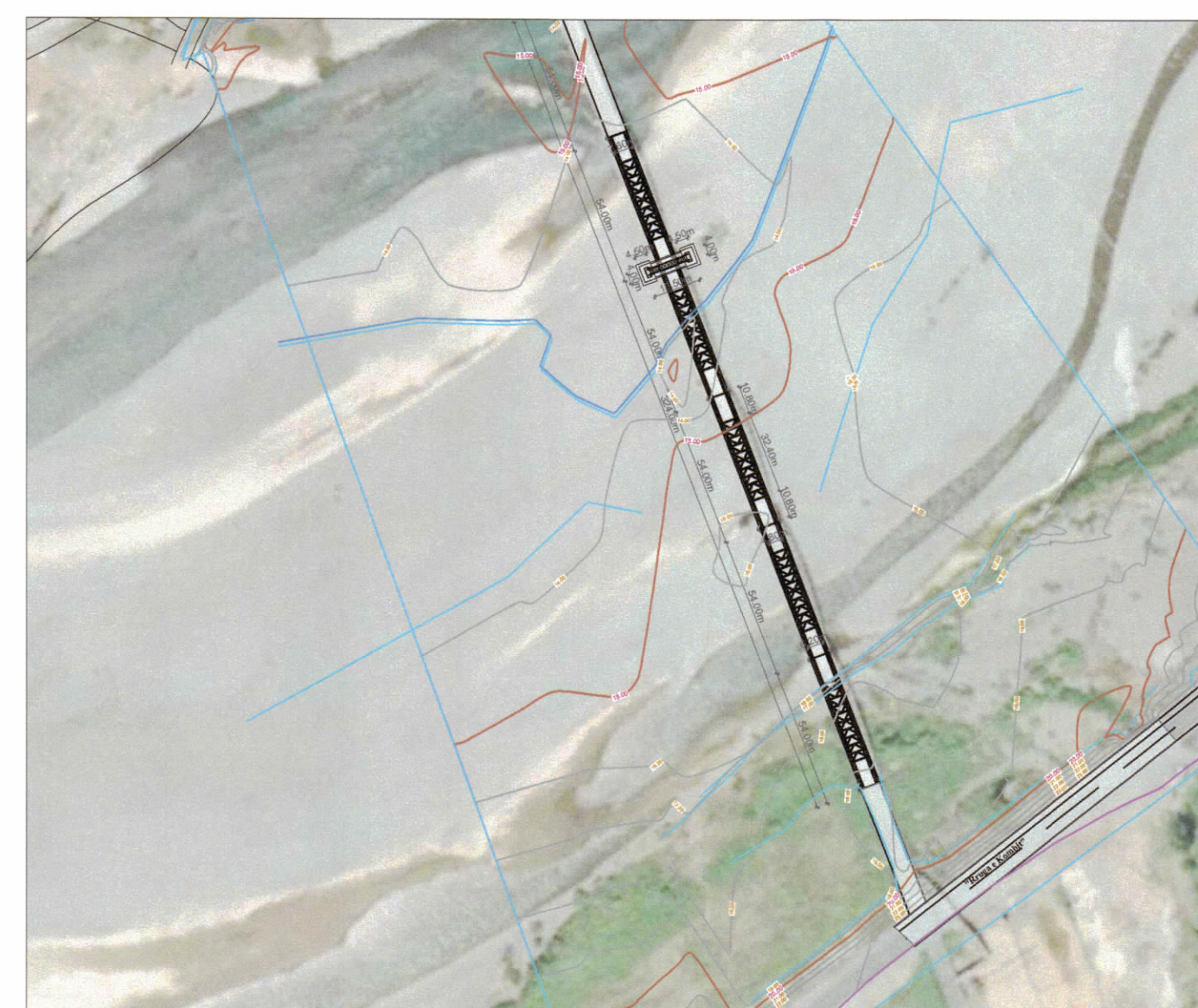
HARTA TOPOGRAFIKE SHK. 1:2500