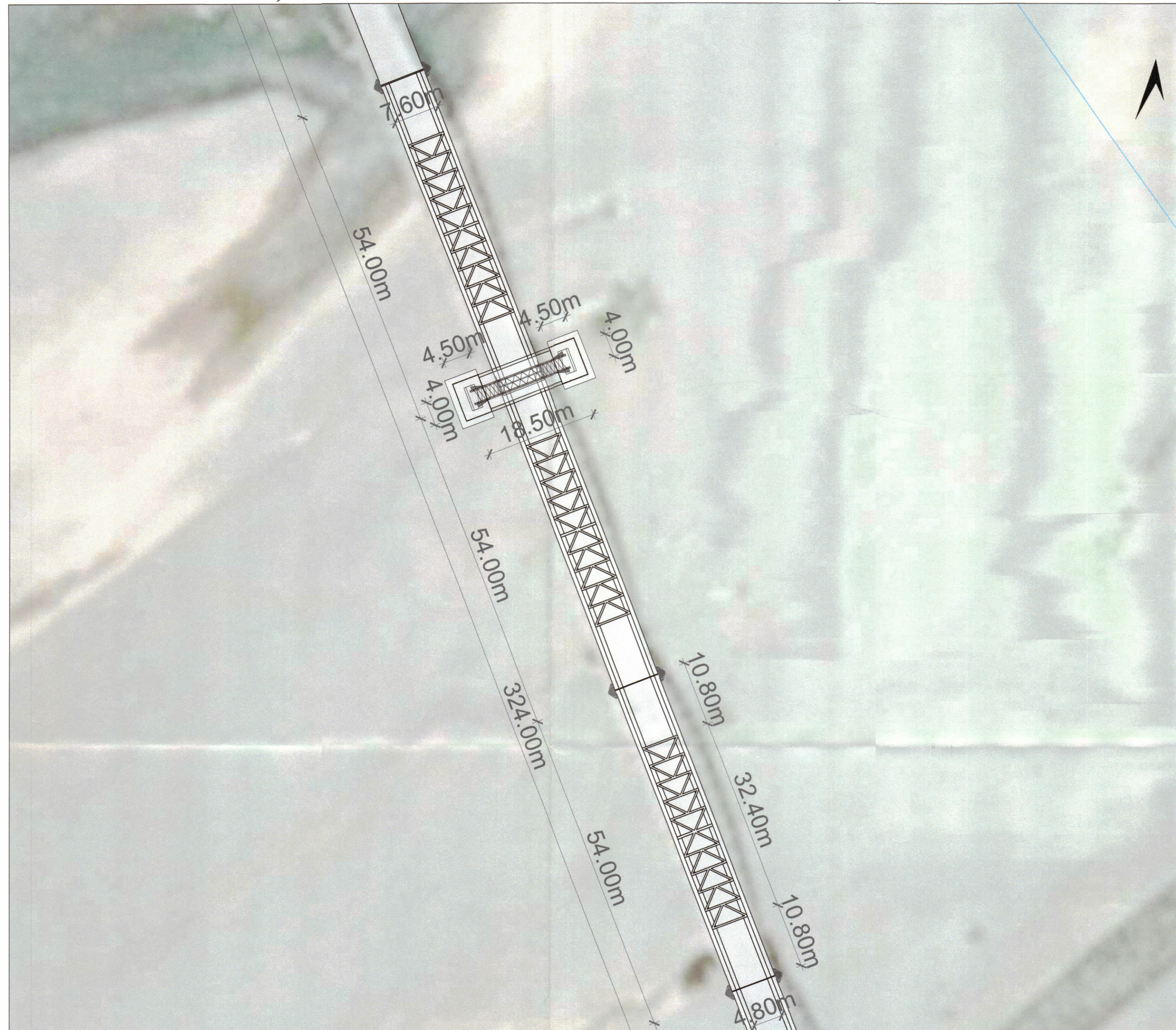
PLANI I VENDOSJES SË STRUKTURËS SHK. 1:500