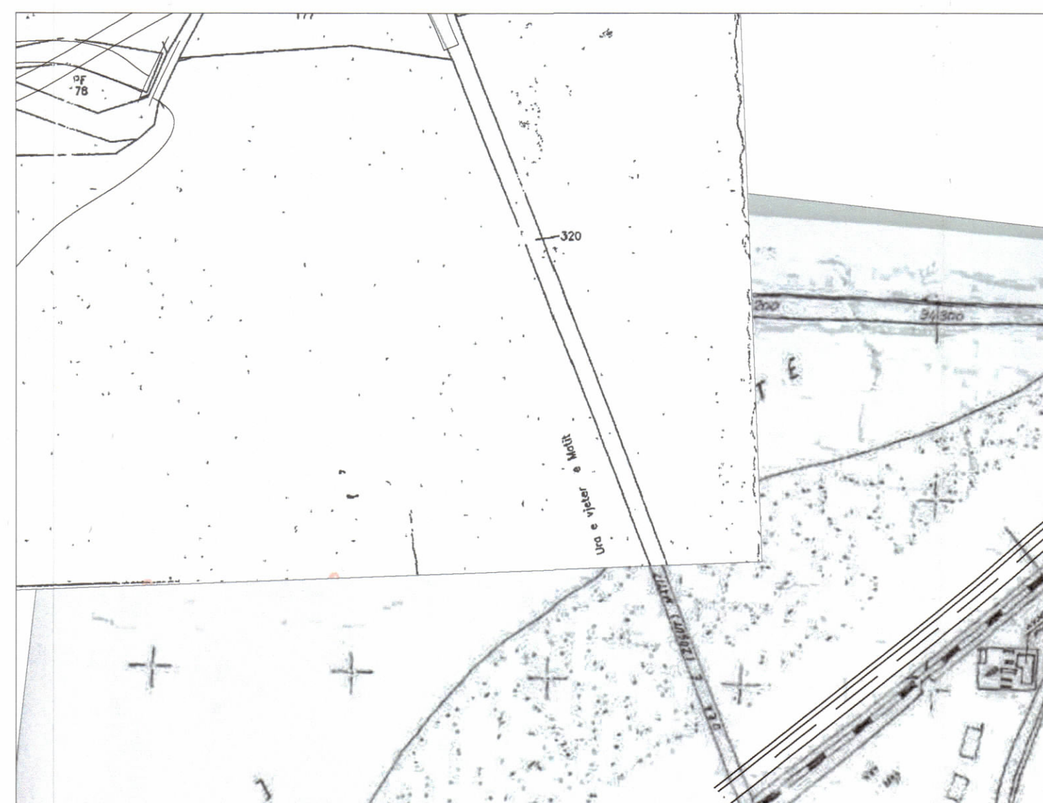
POZICIONI KADASTRAL SHK. 1:2500