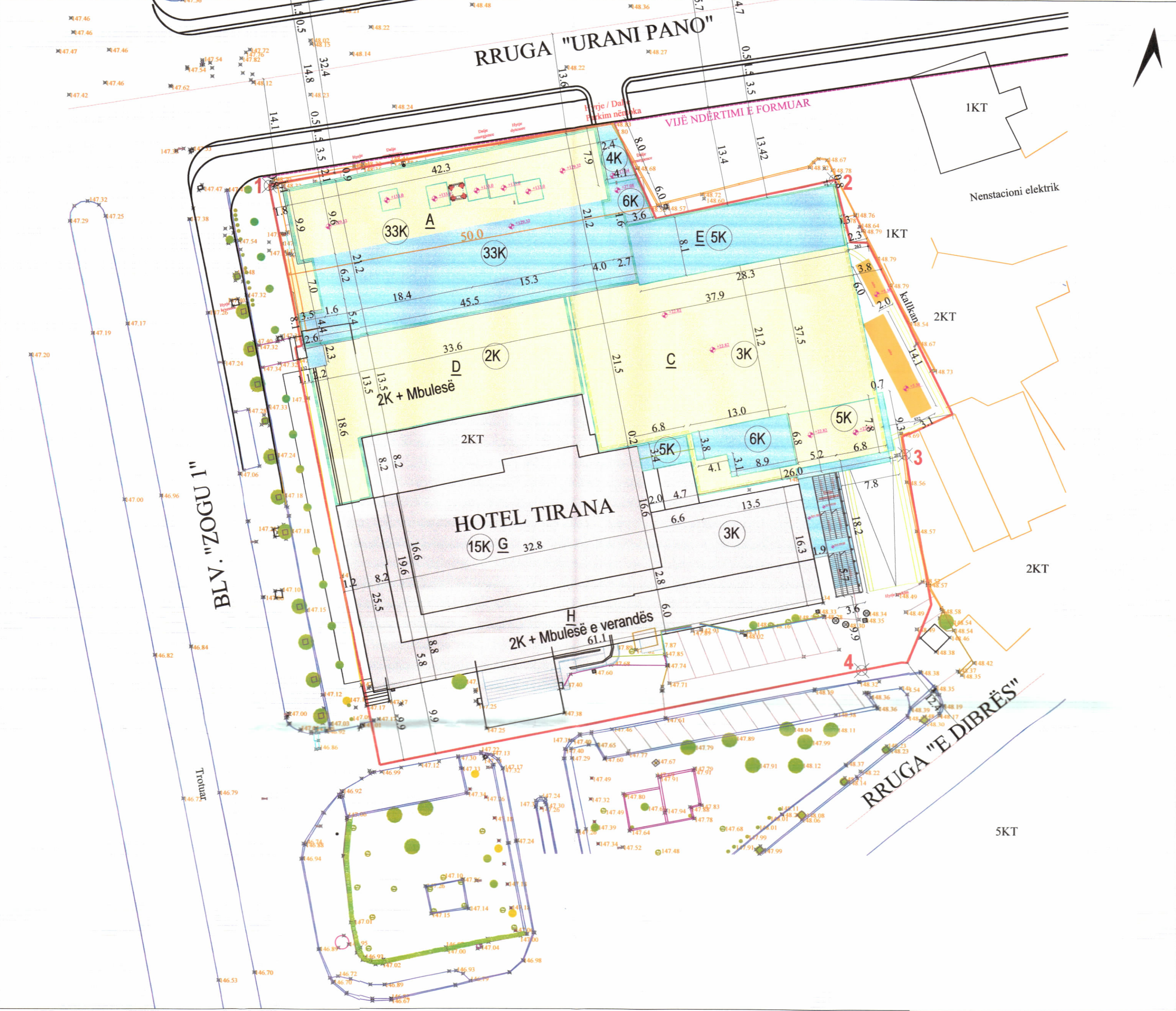
PLANI I VENDOSJES SË STRUKTURËS SHK. 1:400

PËR DISA NDRYSHIME NË VENDIMIN E KKT-SË NR. 15, DATË 02.02.2018 "PËR MIRATIMIN E LEJES SË ZHVILLIMIT PËR OBJEKTIN: " ZGJERIM I KAPACITETEVE AKOMODUESE E SHËRBIMEVE TË HOTEL TIRANA INTERNATIONAL ME SHITESË ANËSORE DHE KULLË ME DESTINACION HOTEL DHE QENDËR MULTIFUNKSIONALE TREGTARE E SHËRBIMESH", BASHKIA TIRANË.