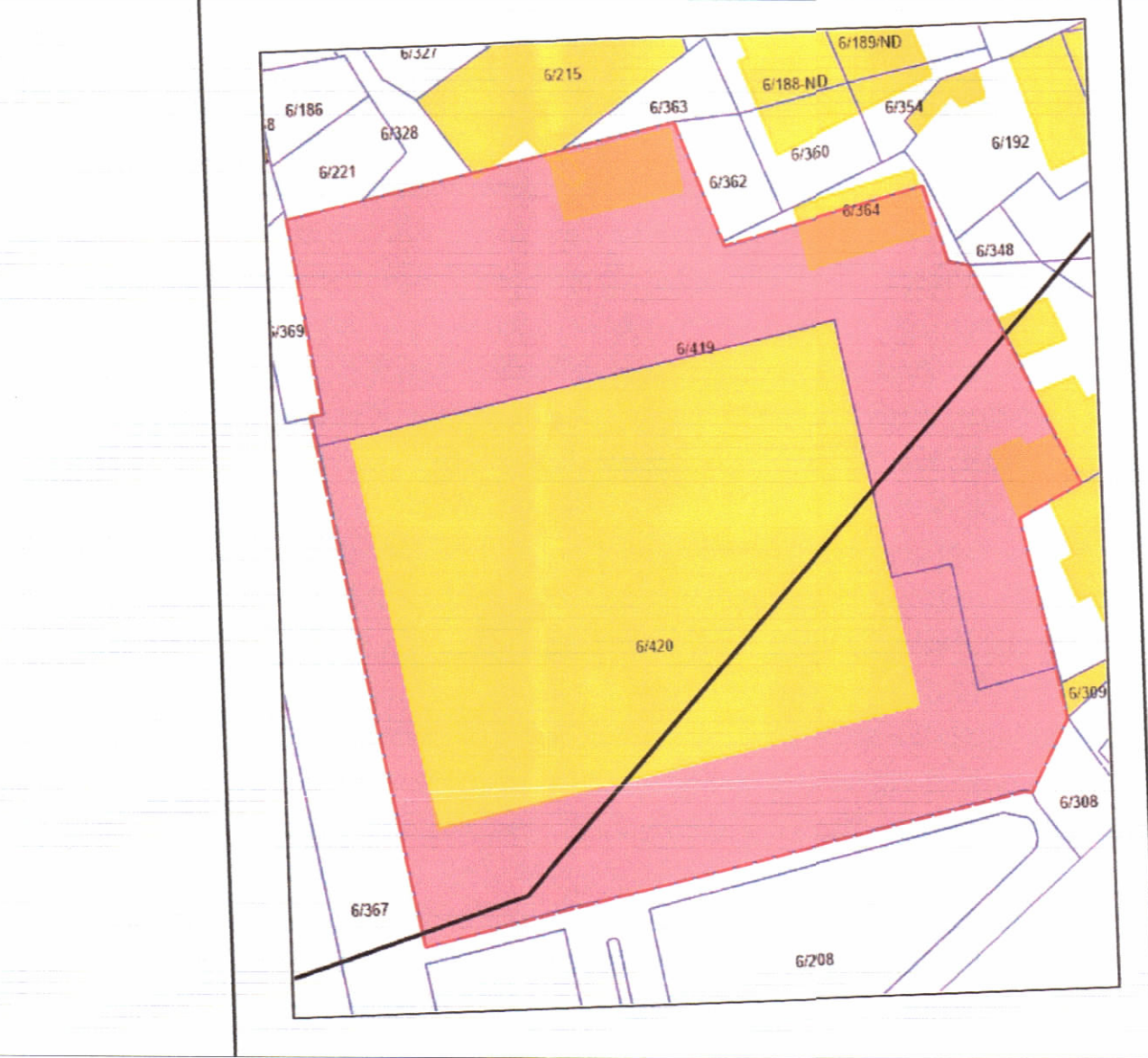
POZICIONI KADASTRAL SHK. 1:750