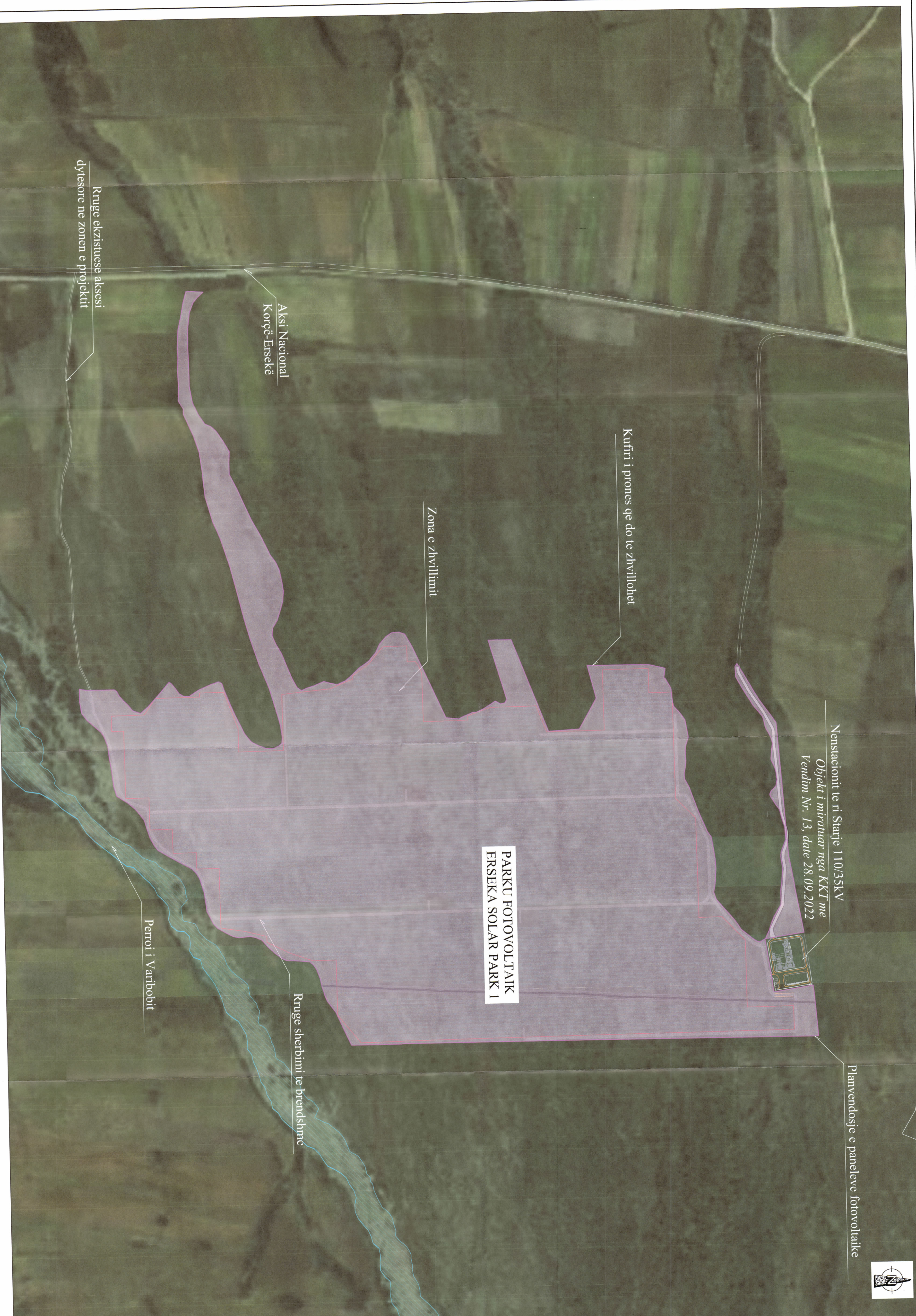
PLANI I VENDOSIES SË STRUKTURËS SHK. 1: 2500