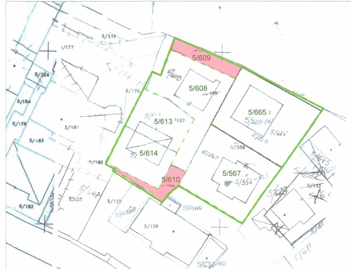
POZICIONI KADASTRAL SHK. 1:500