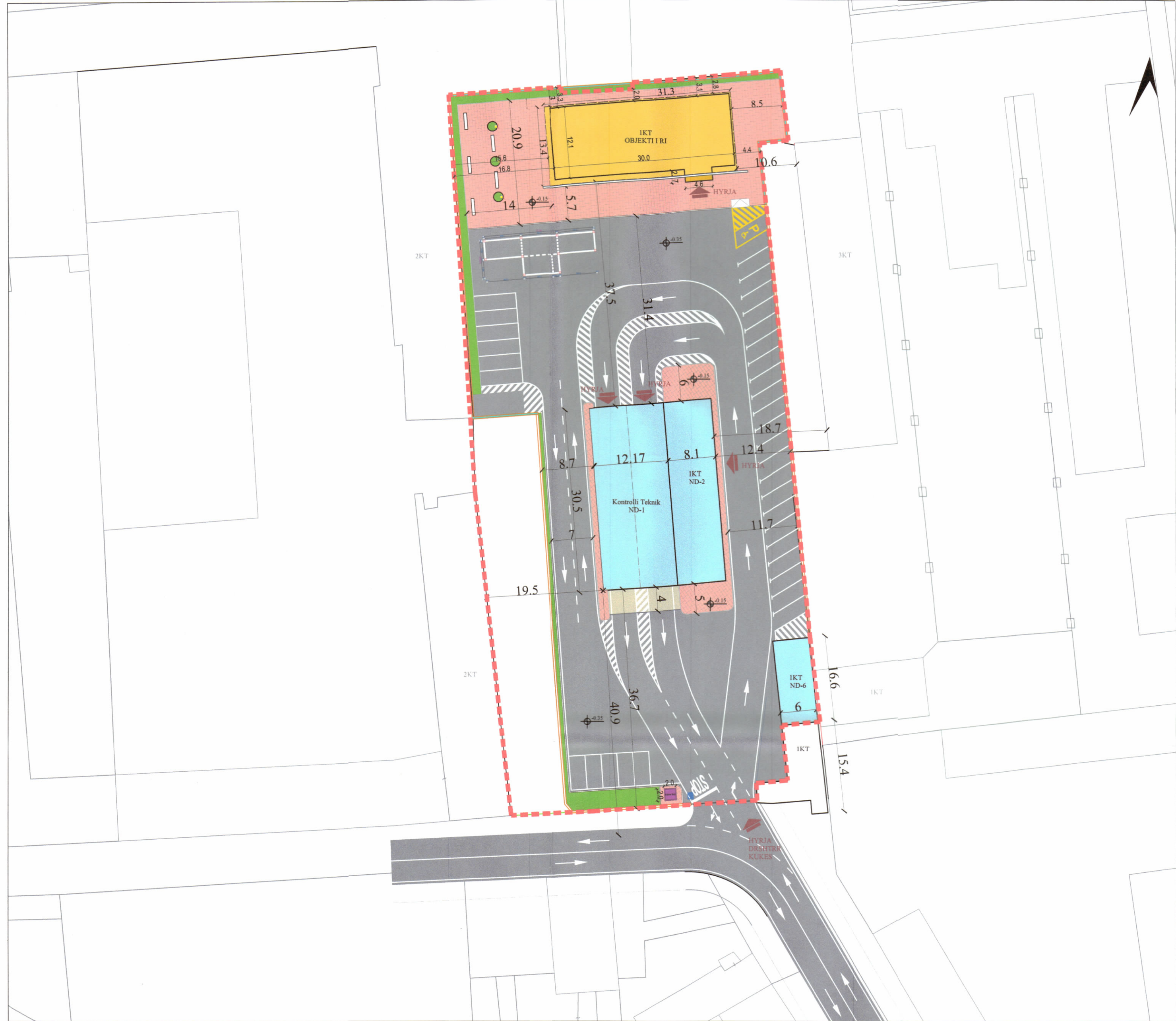
PLANI I VENDOSJES SË STRUKTURËS SHK. 1:500