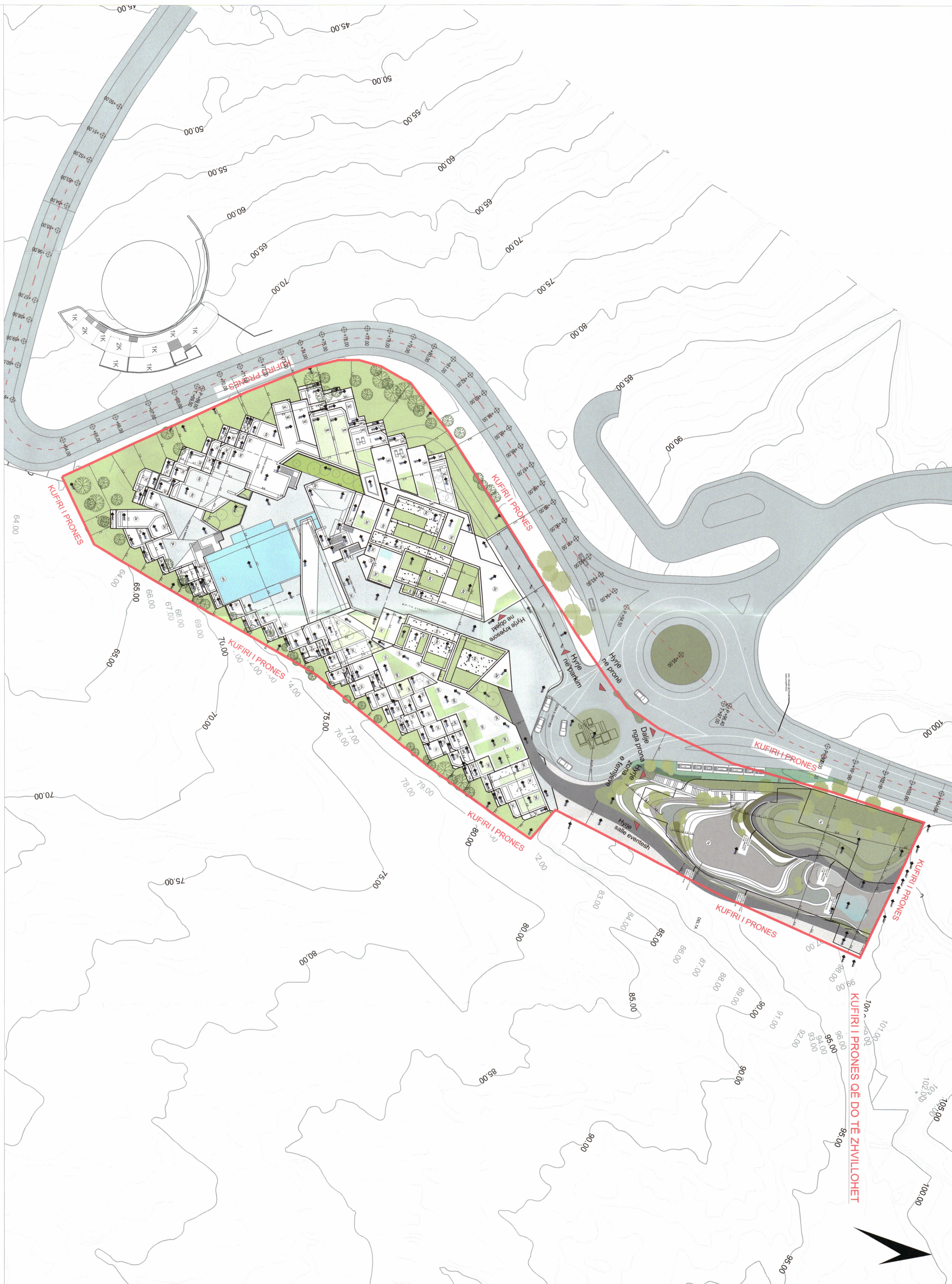
PLANI I VENDOSJES SË STRUKTURËS SHK. 1:500