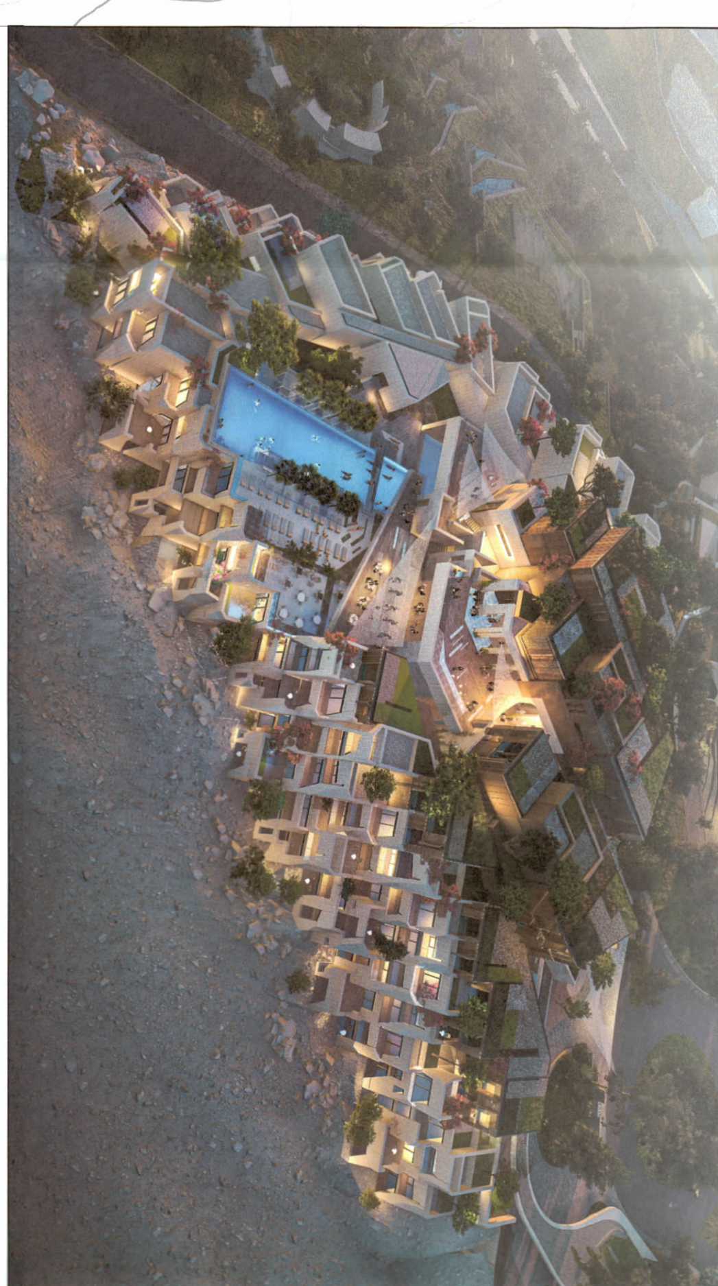
PAWUE 3 DIMENSIONALE