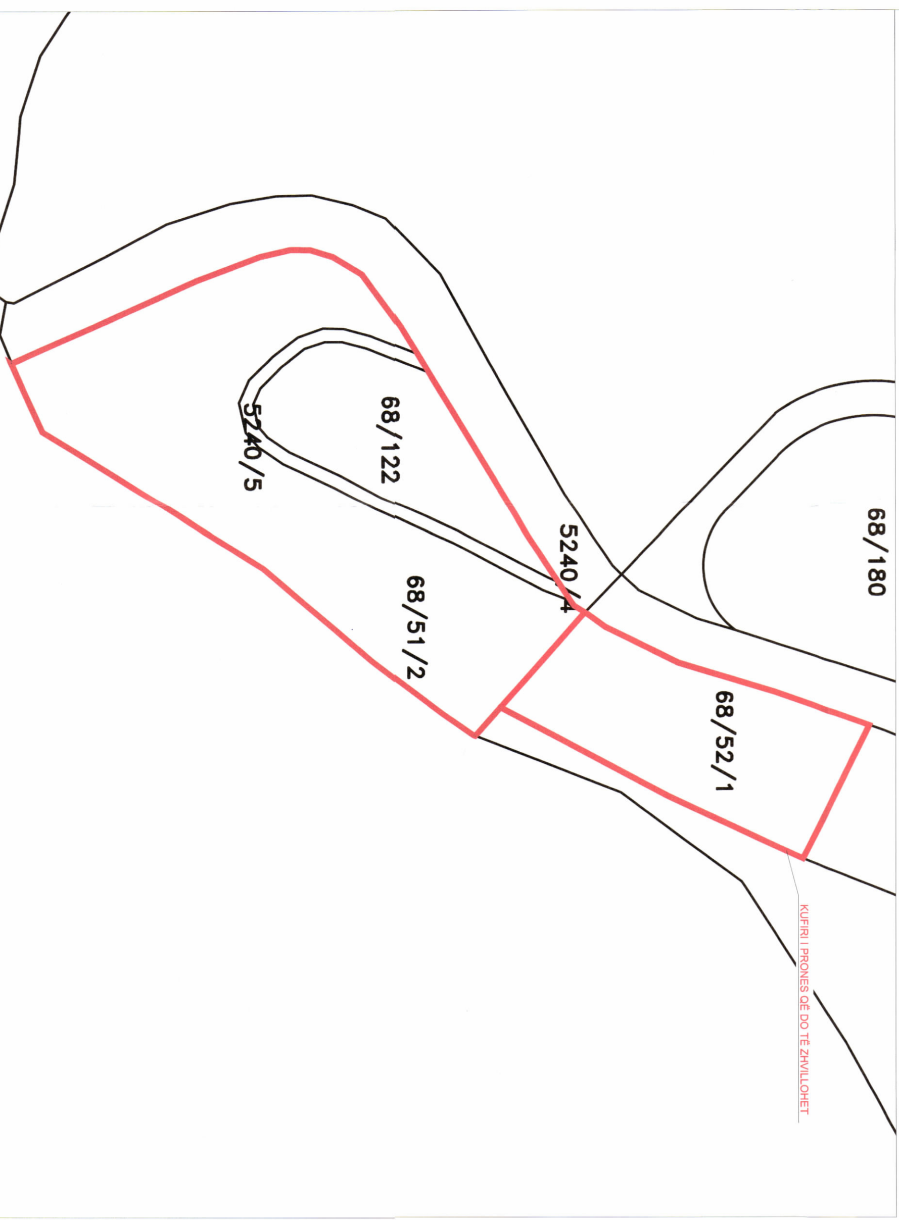
POZICIONI KADASTRAL SHK. 1:1000