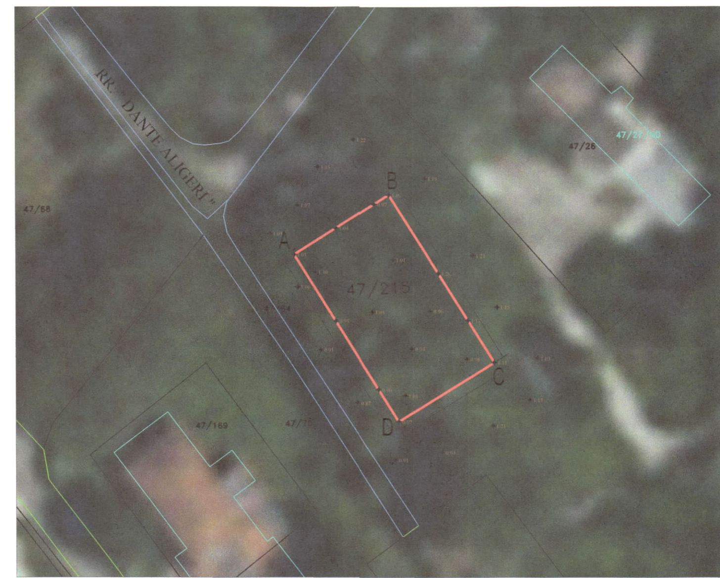
HARTA TOPOGRAFIKE SHK. 1:500