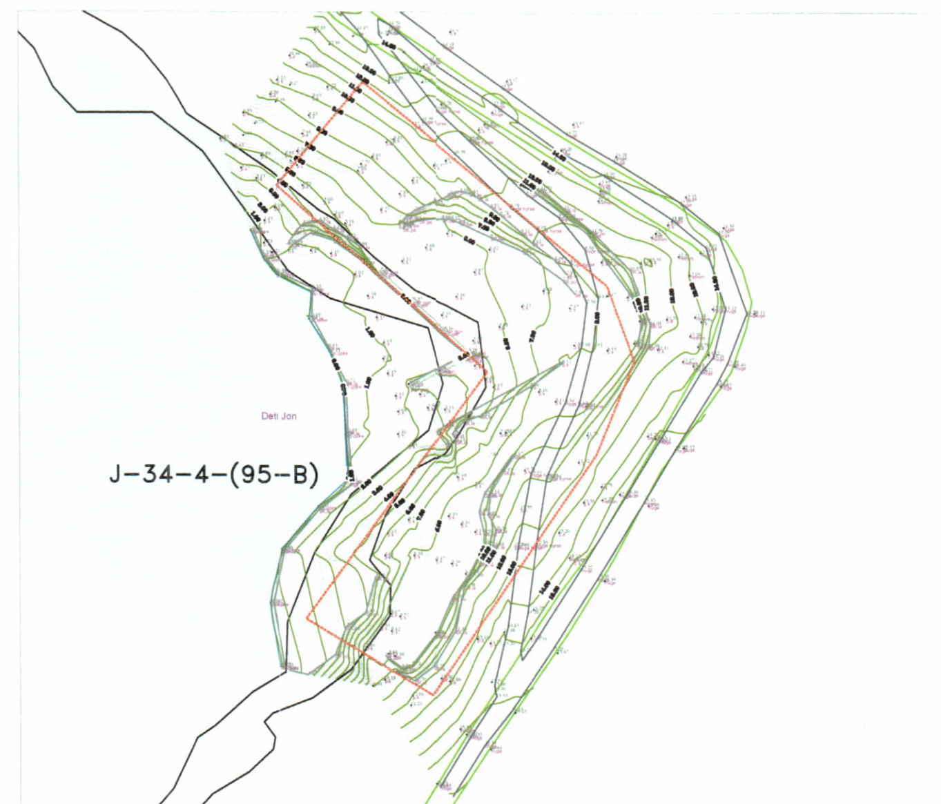
HARTA TOPOGRAFIKE SHK. 1:750