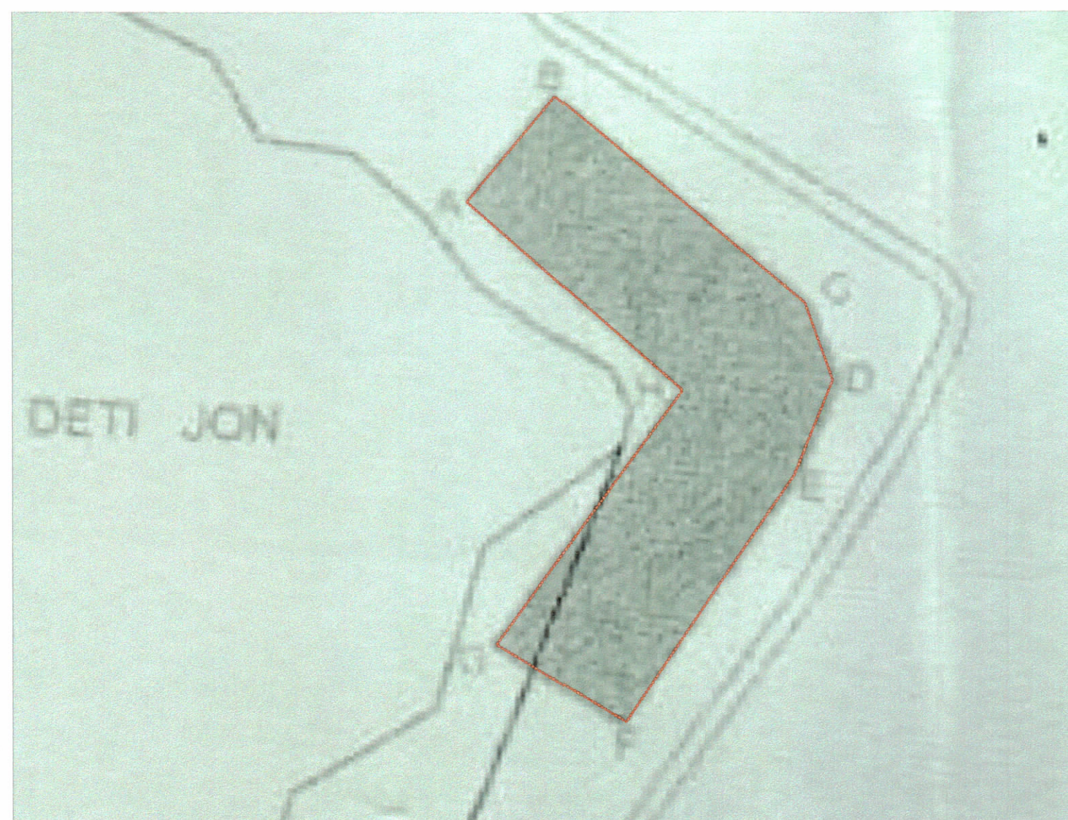
POZICIONI KADASTRAL SHK. 1:750