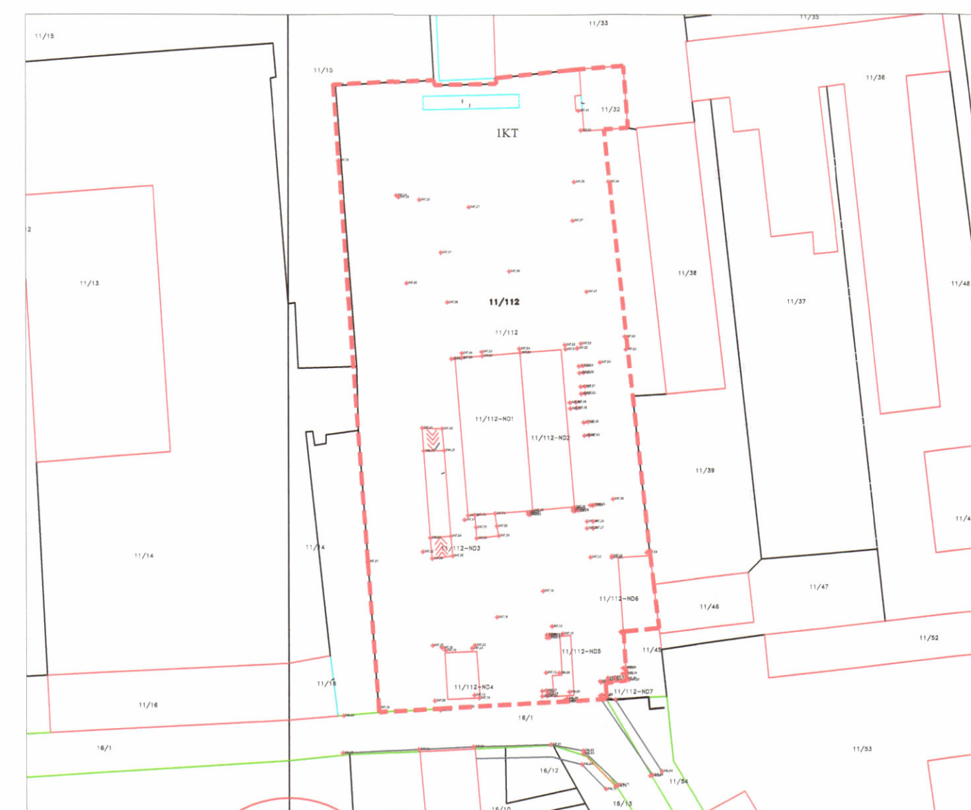
HARTA TOPOGRAFIKE SHK. 1:1000