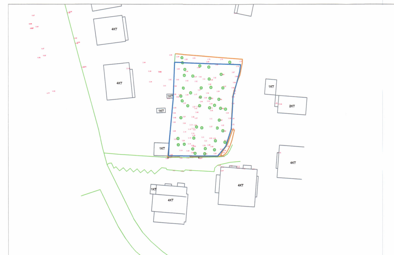
HARTA TOPOGRAFIKE SHK. 1:1000