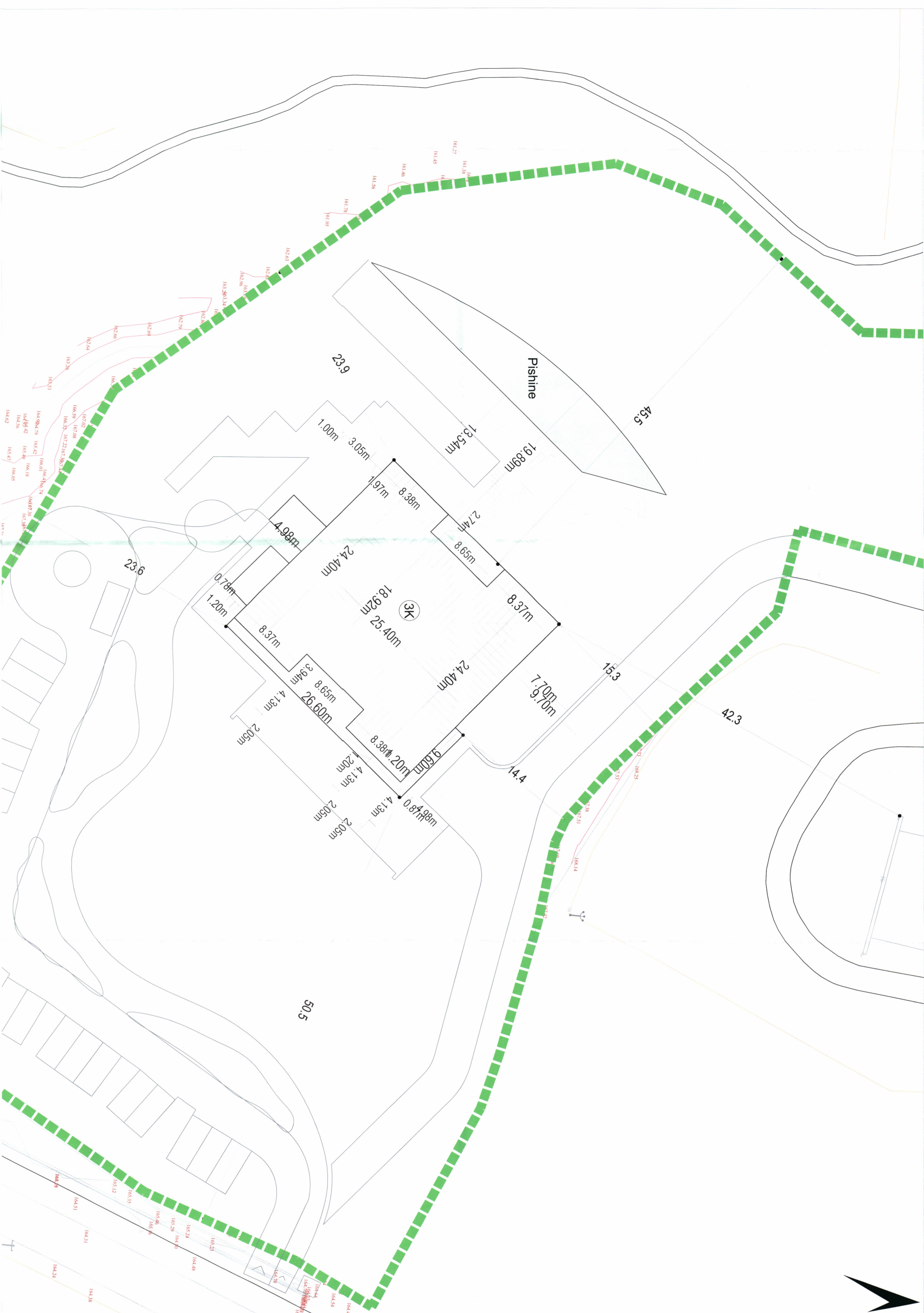
PLANI I VENDOSIES SË STRUKTURËS SHK. 1: 500