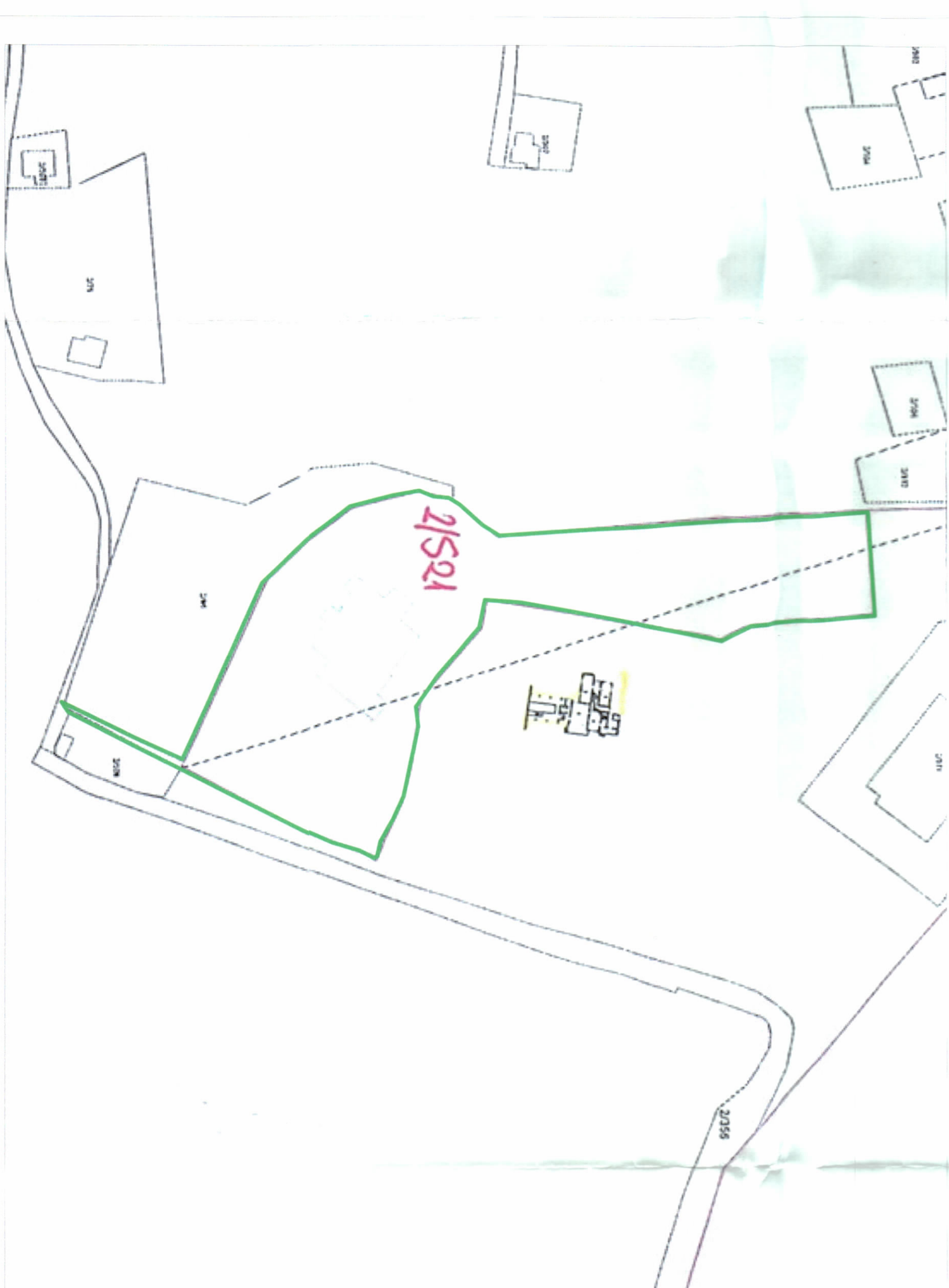
POZICIONI KADASTRAL SHK. 1:1500